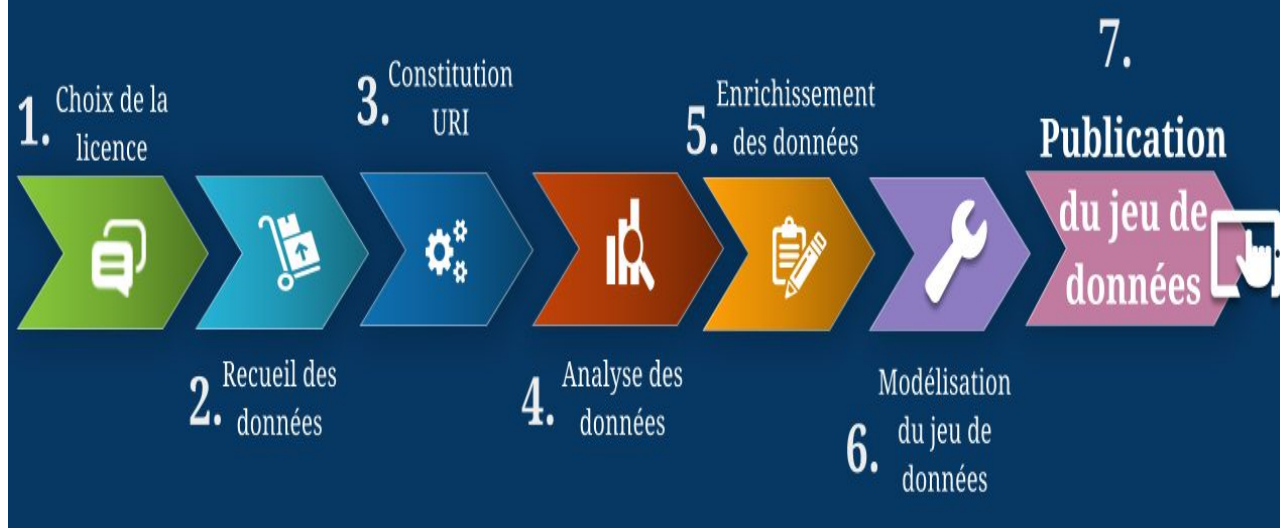
Fig. 1: Représentation schématique du processus intellectuel