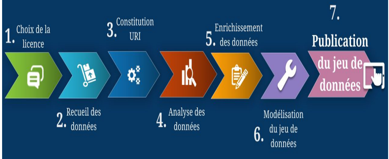
Fig. 1: Représentation schématique du processus intellectuel