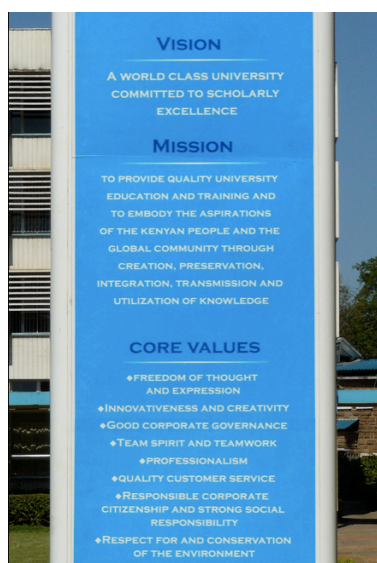
Les trois fétiches « vision », « mission » et « core values » placés à l'entrée du campus principal de l'UoN. 01/01/2012, Nairobi