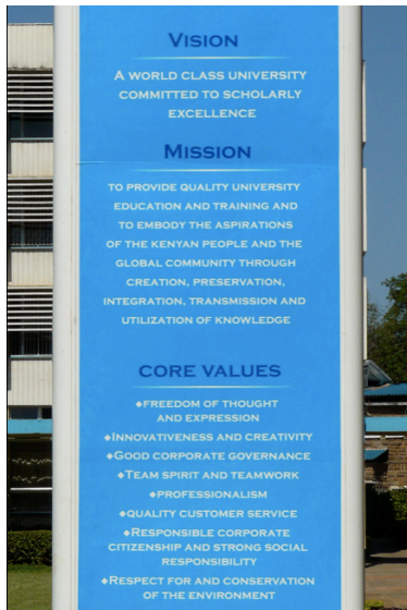
Les trois fétiches « vision », « mission » et « core values » placés à l'entrée du campus principal de l'UoN. 01/01/2012, Nairobi