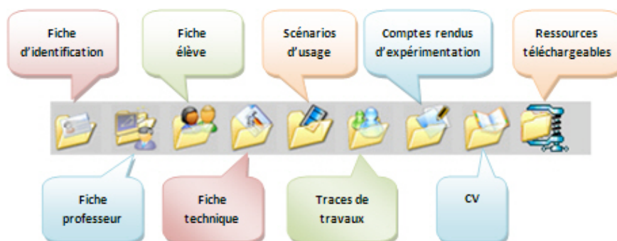
Figure 1. Le modèle 2006 de ressources pédagogiques du SFoDEM

Afin de faciliter le travail collaboratif et la mutualisation, ce modèle va progressivement s'enrichir d'une fiche CV ( curriculum vitae ) de la ressource et d'une fiche Traces de travaux d'élèves (Figure 1).