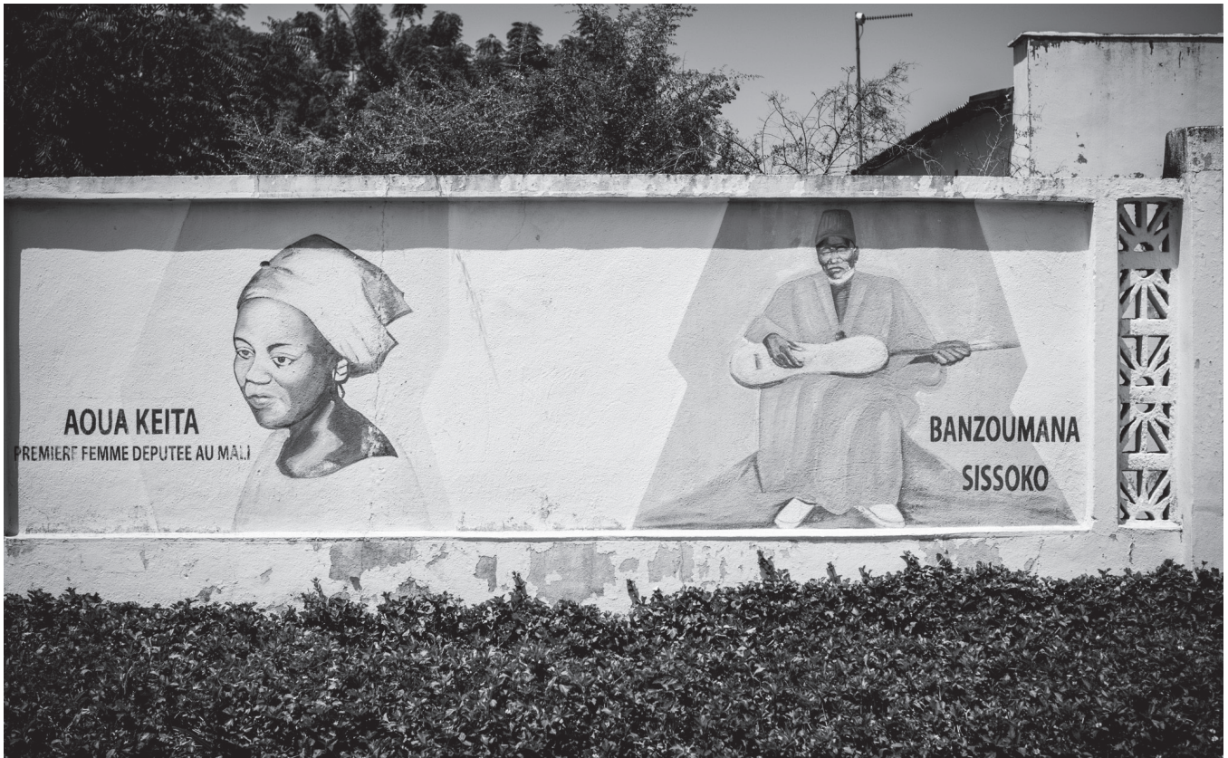
« Première femme députée du Mali. Aoua Keita ». Fresque murale située sur la colline de Koulouba à Bamako. Le griot Bazoumana Sissoko est l'auteur de la musique de l'hymne national du Mali. 2014.

moins question ici de commémorer une lutte politique que des martyrs. C'est à ce titre qu'une icône maternelle y trouvait sa place.