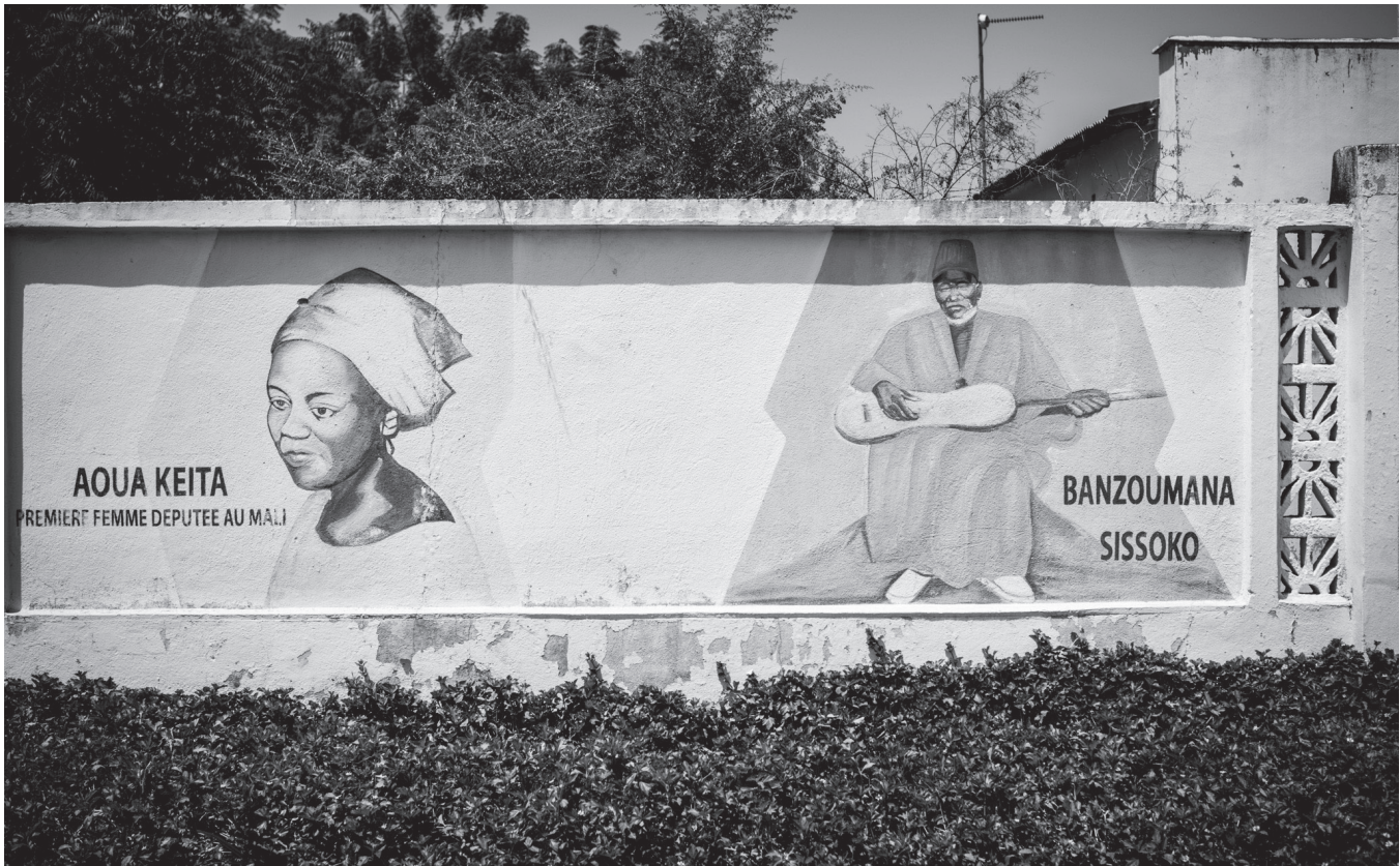
« Première femme députée du Mali. Aoua Keita ». Fresque murale située sur la colline de Koulouba à Bamako. Le griot Banzoumana Sissoko est l'auteur de la musique de l'hymne national du Mali. 2014.

moins question ici de commémorer une lutte politique que des martyrs. C'est à ce titre qu'une icône maternelle y trouvait sa place.