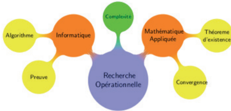
Fig. 1. Composantes de la recherche opérationnelle

nels (utilisable sur le terrain des opérations) par des méthodes scientifiques à l'aide de programmes informatiques.