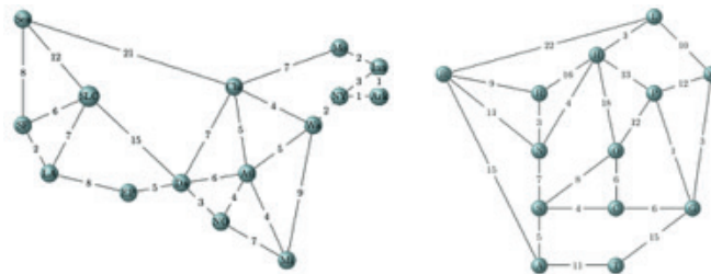
Fig. 3. Exemples de graphes