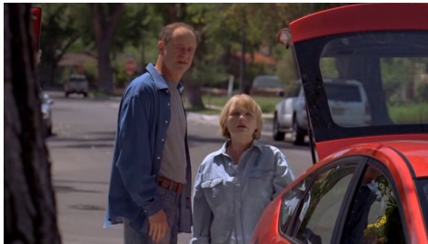
Mother : "Poor Jake, he had his heart set on going to space camp."

Le jour où le propriétaire doit prendre possession de la maison, inutile de dire que Jesse n'est pas attendu. Il passe devant ses parents et ouvre la porte d'entrée; il prend plaisir à narguer ses parents, qui n'ont pas compris ce qui allait se passer.