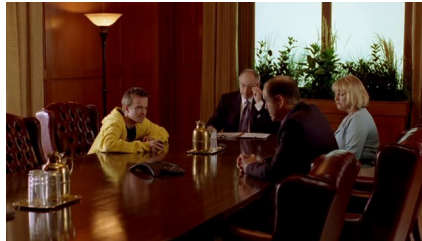
“You're kicking me out of my own house?”

On peut tout à fait appliquer cette lecture générique aux séries étudiées, car il est vrai qu'à chaque mensonge, à chaque mystère, à chaque coup dangereux, le public se rapproche encore du héros. Par exemple, on peut rapidement ressentir de l'empathie pour Jesse, l'acolyte de Walter. Dans l'épisode « Down 21 » (2:4), ses parents le forcent à quitter la maison de sa défunte tante parce qu'il se drogue.