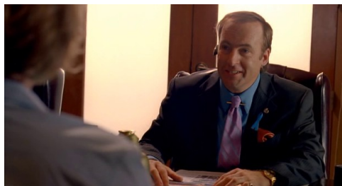
"I represent a client who shall remain nameless."

Plus tard dans l'épisode, une première séquence s'ouvre sur Saul qui attend seul dans la salle de réunion où Jesse a appris que ses parents l'expulsaient de ce qu'il pensait être sa maison. Les parents de Jesse entrent accompagnés de leur avocat. On comprend qu'ils ne connaissent pas le nom du potentiel acheteur de leur maison.