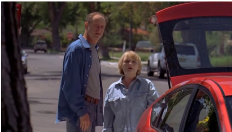
Mother : "Poor Jake, he had his heart set on going to space camp."

Le jour où le propriétaire doit prendre possession de la maison, inutile de dire que Jesse n'est pas attendu. Il passe devant ses parents et ouvre la porte d'entrée; il prend plaisir à narguer ses parents, qui n'ont pas compris ce qui allait se passer.