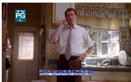
Hal dans Malcolm in the Middle

totallement investie par le personnage. Dans Breaking Bad , l'acteur Bryan Cranston se voit ainsi dépouillé des atours de Hal, le père de Malcolm dans Malcolm in the Middle (Fox, 2000-2006, Linwood Boomer). Pour ce faire, le pilote nous présente un Bryan Cranston effectivement déshabillé mais encore avec quelques atours comiques et maladroits. Dans le pilote, la scène du suicide manqué, où Walt presse sur la détente sans qu'aucun coup ne parte, en vient presque à bout. Ce suicide, bien que manqué, opère au niveau symbolique et nous fait basculer, avec le héros, dans la construction de l'altérité.