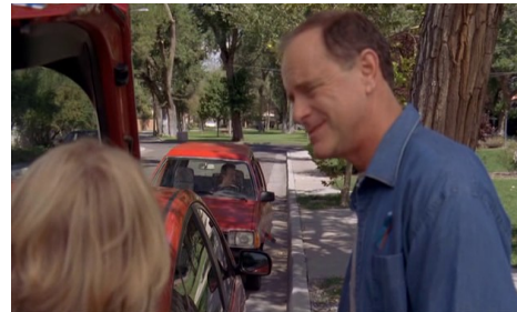
Thatcher : "God, this is all we need."