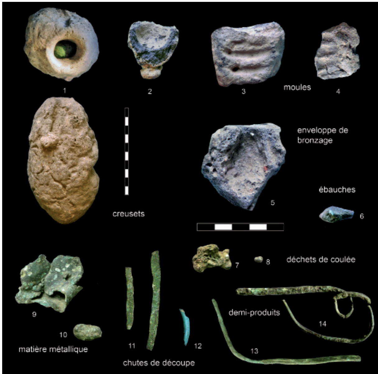
Fig. 1. Exemples des vestiges liés à l'artisanat des alliages cuivreux découverts sur le site de Lacoste durant l'opération de fouille préventive. 1. 3008.1.0.1 ; 2. 3008.3.0.4 ; 3. 3009.3.0.1 ; 4. 3009.3.0.2 ; 5. 3009.5.0.5 ; 6. 1003.6.0.11 ; 7. 1003.5.0.2 ; 8. 1000.1.0.8 ; 9. 1001.4.0.4 ; 10. 1005.6.0.13 ; 11. 1002.11.0.1 ; 12. 1001.6.0.2 ; 13. 1000.9.0.6 ; 14. 1004.1.0.1. 1 à 5. Terre cuite, 6 à 14. Alliages à base de cuivre.