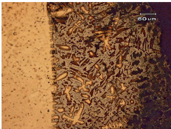
Fig. 2. Micrographie d'une tôle (1000.2.0.1). Interface entre les deux coulées successives.