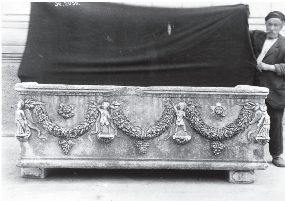
Fig. 2 : Sarcophage à guirlandes (notice Mendel 1160) : prise de vue avec un assistant tenant un drap sombre.