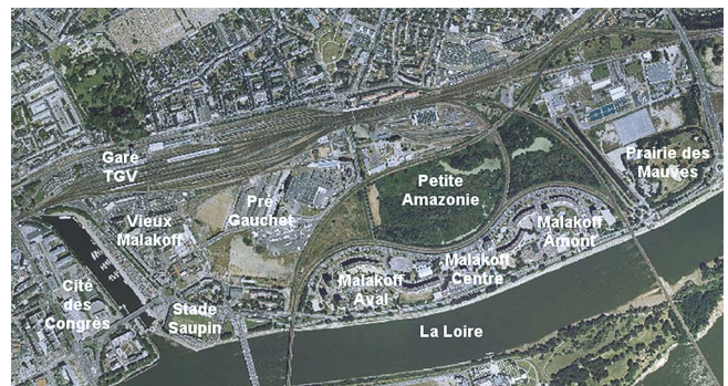
Fig. 1 - Le quartier Malakoff avant transformations en 1999, (source : Nantes Métropole)

Le quartier, découpé par un système d'axes qui le traverse, entre boulevards urbains et voies de chemin de fer, représente une surface de 164 hectares située à proximité de l'hyper-centre de Nantes. Ce secteur regroupe un site d'activités ferroviaires, une usine de traitement des eaux, un grand stade actuellement réhabilité (Marcel Saupin), une déchetterie ainsi qu'un ensemble de