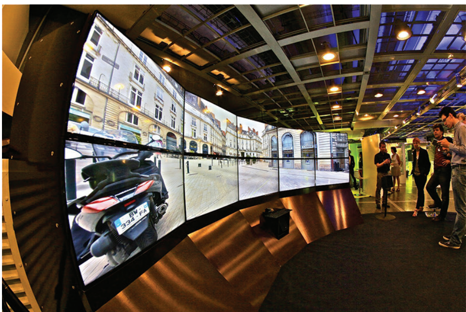
Installation immersive de l'interface HAUP au salon Innovatives SHS à La Villette

L'installation spécifiquement conçue pour Innovatives SHS a permis de spatialiser les sons urbains dans l'image panoramique des places Royale et Graslin à Nantes au sein d'un système de projection immersif, Naexus , équipé de dix écrans panoramiques en arc de cercle et de six enceintes pour la restitution tridimensionnelle du son. Pendant le salon, les visiteurs ont pu spatialiser les sons urbains dans l'image panoramique des deux places semi-fermées du XIX e siècle, choisies en regard des enjeux qu'elles représentent du point de vue de l'aménagement et de son impact sonore. La présentation du projet HAUP au directoire du CNRS ainsi qu'à de nombreux acteurs de la société civile a permis de confirmer la potentialité du projet à intéresser non seulement la communauté scientifique et les aménageurs, mais aussi les cinéastes (pour le maquettage dynamique des scènes sonores en préparation de tournage), les opérateurs de télécommunications (visite des représentants de Lab Orange ) et les éditeurs de jeux vidéo (pour la spécificité de l'interaction sonore).