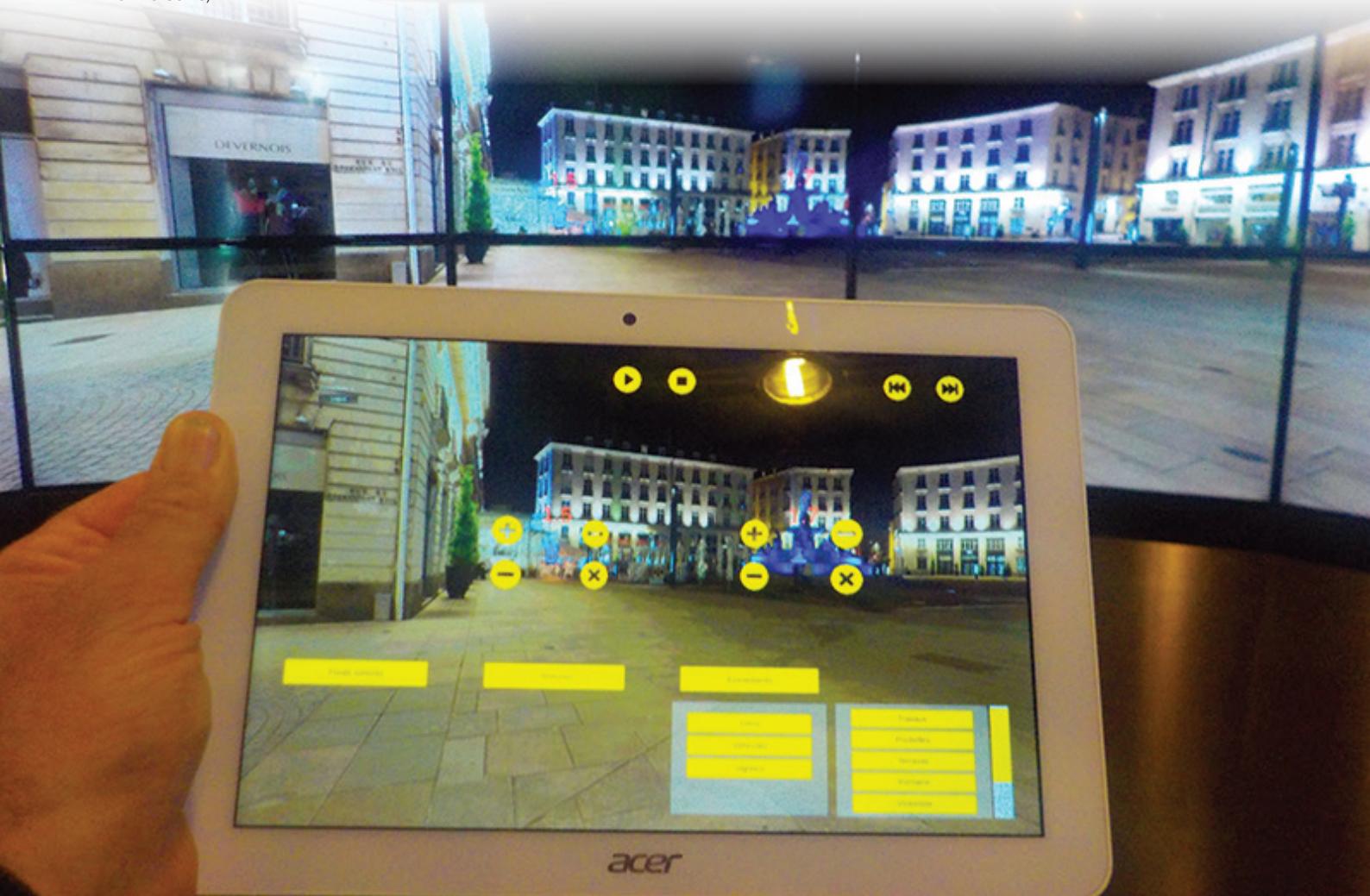
Installation immersive de l'interface HAUP au salon Innovatives SHS à La Villette

► Enfin, ce système de médiation autorise la manipulation de données culturelles, historiographiques ou archéologiques spatialisées pour la reconstitution, la conservation ou la promotion patrimoniale des paysages présents, passés ou futurs.