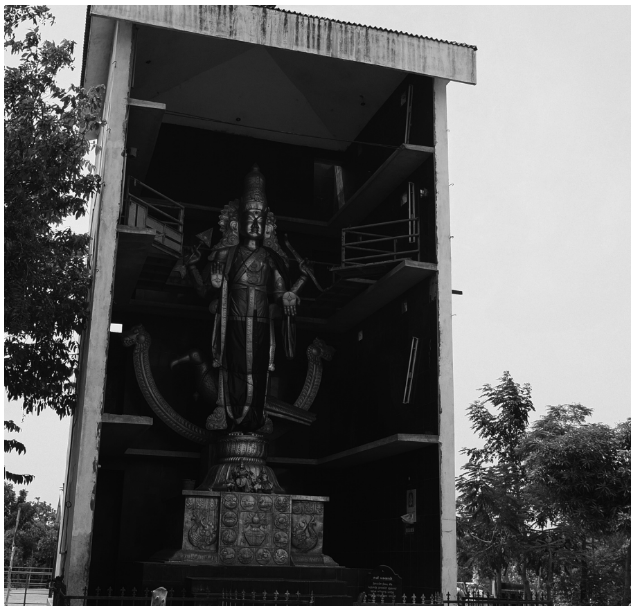
Fig. 6 : Les statues imposantes de Śaṇi (en haut) et de Vināyaka (en bas) dans le nouveau sanctuaire de Morattandi (2013)