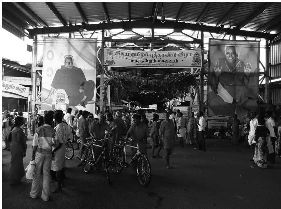
Fig. 7 : Pèlerins à l'entrée du temple du gourou (en haut) et l' Institute of Medical Sciences and Research créé par les fondations (en bas) (2013)