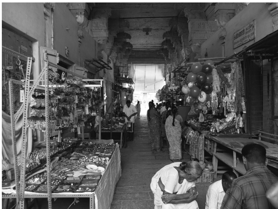
Fig. 3 : Étals à l'entrée du grand temple de Tiruchengodu

lieu de culte. Cette combinaison entre attraction et interdit autour du temple hindou se retrouve dans la structuration de l'habitat des groupes sociaux. Depuis des siècles en effet, l'habitat des castes parias (longtemps nommées « intouchables » et plus récemment « répertoriées 25 » par l'administration ou dalit 26 par leurs défenseurs militants) est proscrit à proximité des grands temples alors que les plus « hautes » castes résident dans leurs environs. Dans les localités tamoules, les Brahmanes vivent ainsi habituellement à proximité du temple principal, voire dans un quartier monocaste appelé agrahāram 27 lorsqu'ils sont assez nombreux. À Thiruchengodu par exemple, la rue adjacente au temple par le sud est surnommée localement Gurrukal street , ou la « rue des prêtres brahmanes ». Ces observations ne sont pas