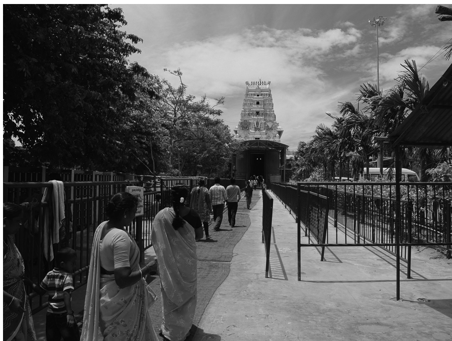
Fig. 5 : Arrivée de fidèles dans le nouveau temple de Hanumān à Panchavadi (2013)

La réputation et le rayonnement de ce nouveau sanctuaire augmentent d'année en année, en résonance directe avec l'essor que connaît le culte de Hanumān depuis plusieurs décennies dans toute l'Inde 30 , où l'on assiste à