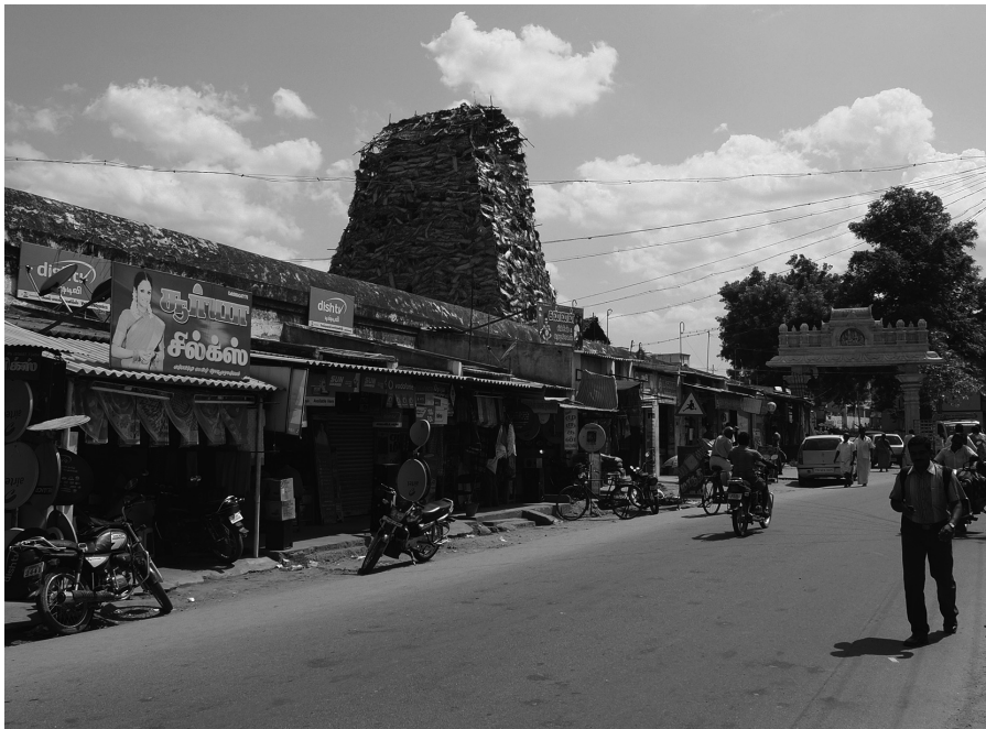
Fig. 4 : Magasins installés sur les terres des temples de Tharamangalam et de Tiruchengodu (2012)