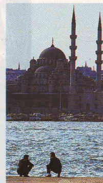
Le Bosphore à Istanbul. A cheval sur deux continents, la Turquie peut revendiquer une appartenance européenne. Mais l'histoire du pays et sa culture musulmane l'orientent aussi vers d'autres valeurs.