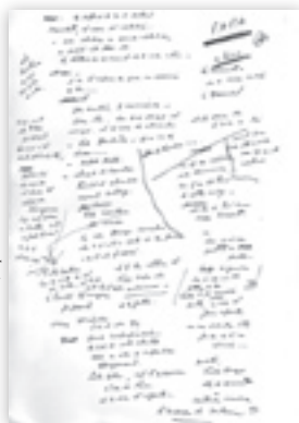
Manuscrit de Prévert pour « Enfance » 2.

Grey dont il divorçait, Prévert recevra en 1953 une lettre admirative de Chaplin 7 , enthousiasmé par Charmes de Londres (ouvrage de 1952, avec des photographies d'Izis). Les deux hommes s'estiment beaucoup et auront l'occasion de se rencontrer plusieurs fois.