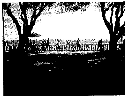
FIGURE-05,06 et 07: Praça da Piedade, Porto da Barra (Salvador da Bahia)