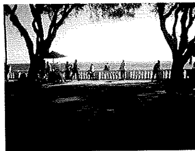
FIGURE-05,06 et 07: Praça da Piedade, Porto da Barra (Salvador da Bahia)