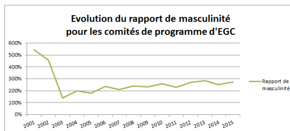
Figure 2. Evolution du rapport de masculinité pour les comités de programme

En étude sur le genre, un indicateur quantitatif issu de la démographie qui peut être utilisé est le rapport de masculinité ; il représente le nombre d'hommes pour 100 femmes. À la naissance, le rapport de masculinité est connu pour être dans la plupart des pays de 105 garçons pour 100 filles (s'il n'y a pas de « politiques » de natalité spécifique par rapport au sexe des bébés). En calculant ce rapport pour les effectifs des membres du CP, on obtient la Figure 2 qui montre qu'après un démarrage de la conférence avec un CP très masculin (7 femmes pour 28 hommes, soit un rapport de masculinité de 536%), le CP s'est ensuite féminisé pour atteindre des rapports de 250 à 280% selon les années, soit 72 à 75% d'hommes. Nous constatons néanmoins une tendance à la hausse de ce rapport de masculinité depuis 2003, ce qui questionne quant aux critères de constitution des CP.