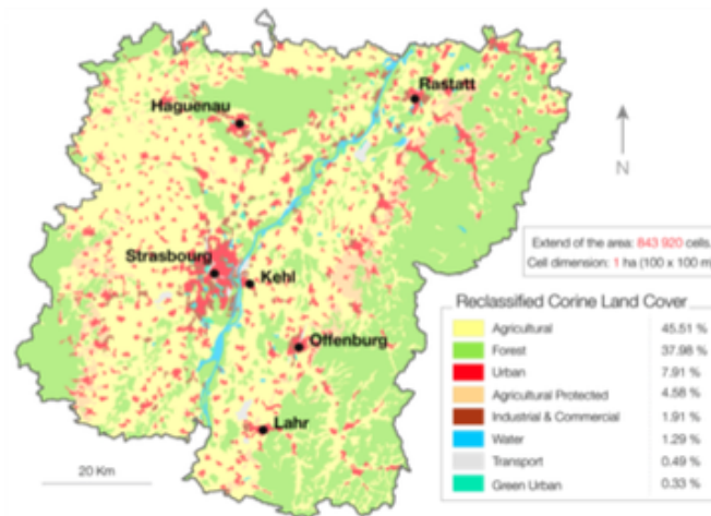
FIGURE 1 – Occupation du sol sur la zone d'étude

mocratisée notamment par R. White G. Engelen (1993), M. Batty Y. Xie (1994, 1997), Clarke et al. (1997) pour ne citer que quelques exemples. L'automate cellulaire a été choisi ici, pour sa simplicité d'utilisation et de compréhension, ainsi que pour son potentiel concernant l'observation et la caractérisation de phénomènes/processus émergents. Comme le souligne W. Tobler (1970) « ce n'est pas parce qu'un processus paraît compliqué qu'il y a cependant une raison de supposer que c'est le résultat d'une règle compliquée ». C'est en s'appuyant sur cette idée que l'utilisation d'un automate cellulaire pour la simulation du développement urbain, prend tout son sens. L'automate cellulaire utilisé est LucSim, développé au sein du laboratoire ThéMA pour répondre aux besoins spécifiques de l'étude et de la méthodologie développée.