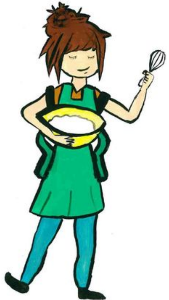
illustration par Marie-E, du collège Marguerite de Valois.

Lancé en septembre 2013, le programme AFCC a structuré des enseignements et 30 ateliers pratiques regroupés sous forme de 5 modules complémentaires couvrant les thèmes de l'alimentation, de la cuisine, de l'environnement, des médias, des métiers... de façon à ce que les adolescents acquièrent, par une mise en pratique guidée, une plus grande conscience des enjeux liés à la consommation alimentaire.