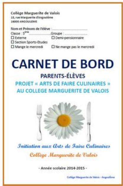
Carnet de bord.

Guider les pratiques culinaires ordinaires des collégiens