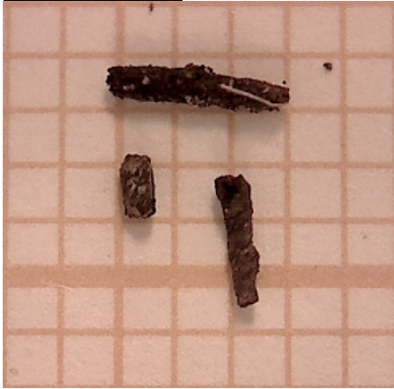
Le fil carbonisé (les carreaux mesurent un millimètre de côté).