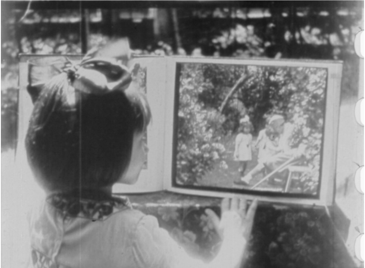
7. Photogramme extrait d'un des films de Desfontaines réalisé pendant la période SCA Voir ECPAD

aurait voulu que ce service fût public, comme l'ensemble des archives de l'État 34 . Sa conception très moderne de l'usage des archives filmées le poussa à envisager de remonter les vues prises auprès des armées combattantes en période de commémoration, et notamment dans la perspective du centenaire de la Première Guerre mondiale. D'où cette proposition, dans sa rubrique de Comœdia , publiée en janvier 1923, concernant l'édification d'une bibliothèque cinématographique :