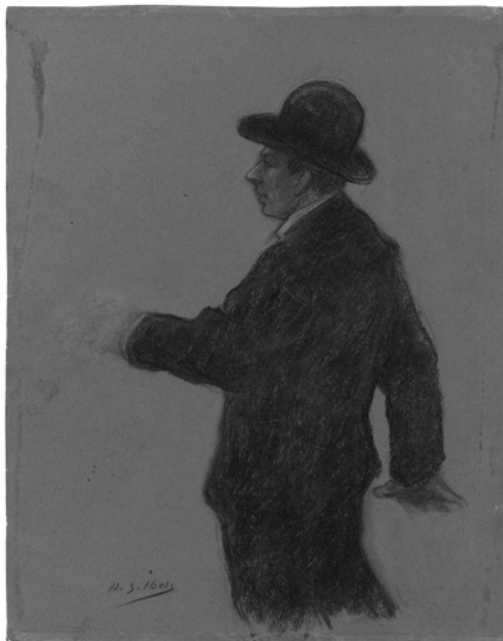
2. Henri-Gabriel Ibels, André Antoine

Dessin, pastel, 28,9 x 22,8 cm BNF, Arts du spectacle, 4-O ICO-33