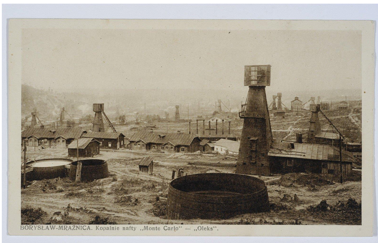
BORYSŁAW-MRAŻNICA. Kopalnie nafty „Monte Carlo” — „Oleks”.

Avec plus de 8 millions d'habitants en 1914, la Galicie était de loin la plus peuplée des onze provinces de la Cisleithanie. Son caractère multi-ethnique était mis en avant dans le premier guide touristique paru pour cette région, cette année-là. Il y était fait mention des « nationalités », « 58,6% de Polonais, 40,2% de Ruthènes et 1,1% d'Allemands », ainsi que des « confessions », « 46,5% de catholiques romains, 42% de catholiques grecs, 0,5% de protestants et 11% d'israélites » (Orlowicz et Kordys, 1). Les auteurs soulignaient que cette région alors la plus densément peuplée d'Europe (102 habitants/km 2 ) était une terre d'émigration (un demi-million de personnes la quittait chaque année), même si le développement de l'industrie pétrolière avait donné naissance à de nouveaux espoirs et amené en Galicie des représentants d'entreprises ou de banques françaises (Compagnie commerciale française), roumaines, néerlandaises, belges (Société anonyme belge des pétroles de Galicie) ou britanniques.