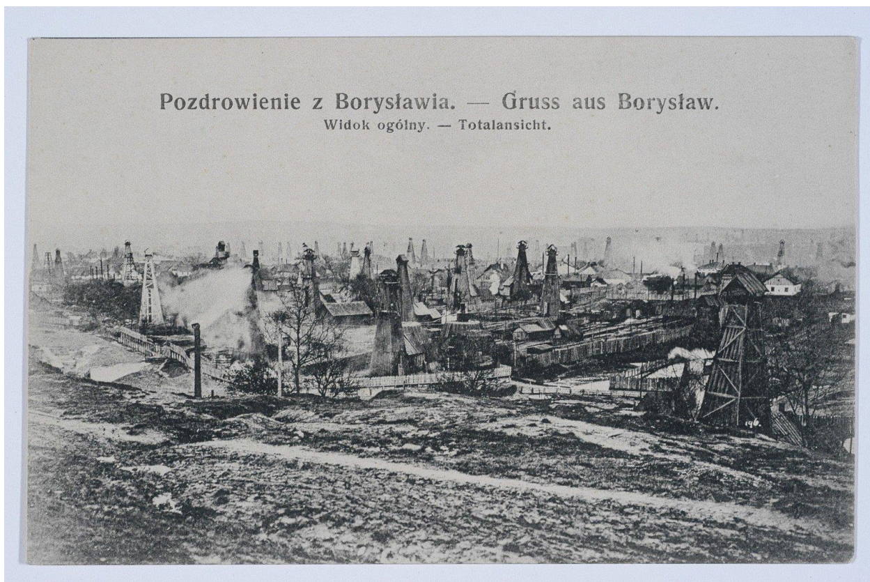
Non daté