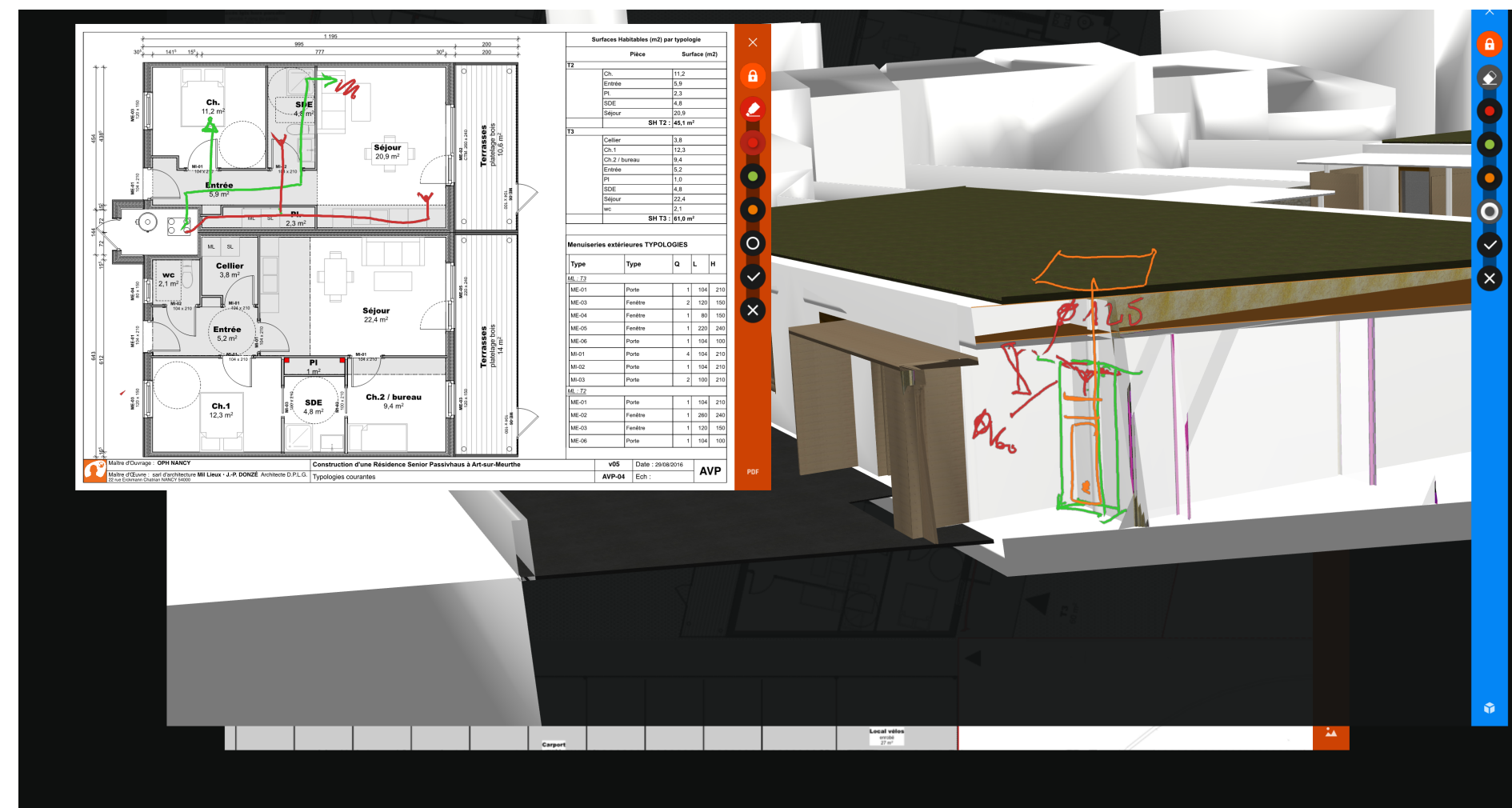
Fig. 4 Annotations du projet dans Shariing.

L'espace de travail synchrone collaboratif numérique au MAP-CRAI (écrans tactiles: une table, un mur) opère avec le logiciel de partage d'environnement de travail "Shariing" ('Immersion') (Fig 3). L'outil d'annotation - un stylo numérique (les annotations sont des croquis 2D/des notes, n'est pas disponible en 3D) (Fig. 4).