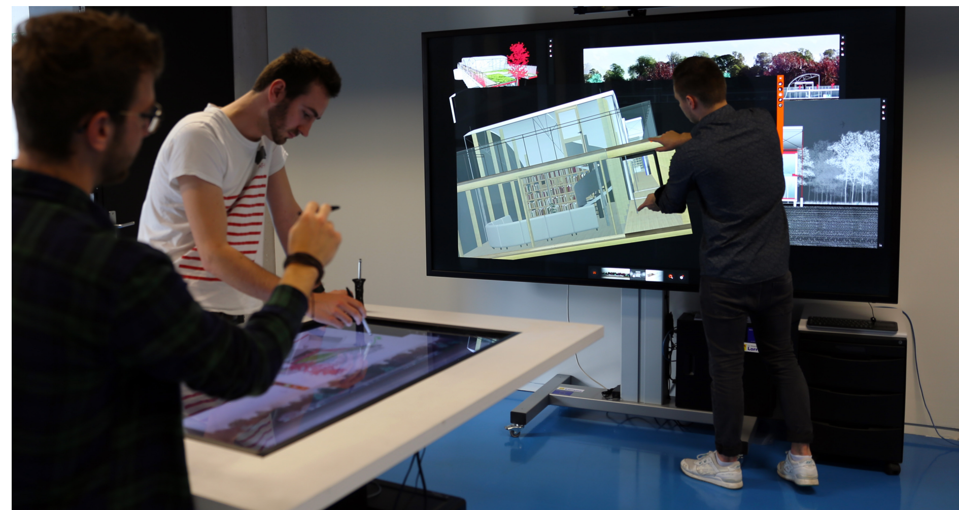
Fig. 3 Espace de travail digitale collaboratif synchrone au MAP-CRAI.

Le choix du support pour la collaboration dépend du type de collaboration souhaitée. Grâce aux approches BIM, les modèles 3D enrichis et les manipulations de visualisation et annotation se retrouvent au cœur de la collaboration.