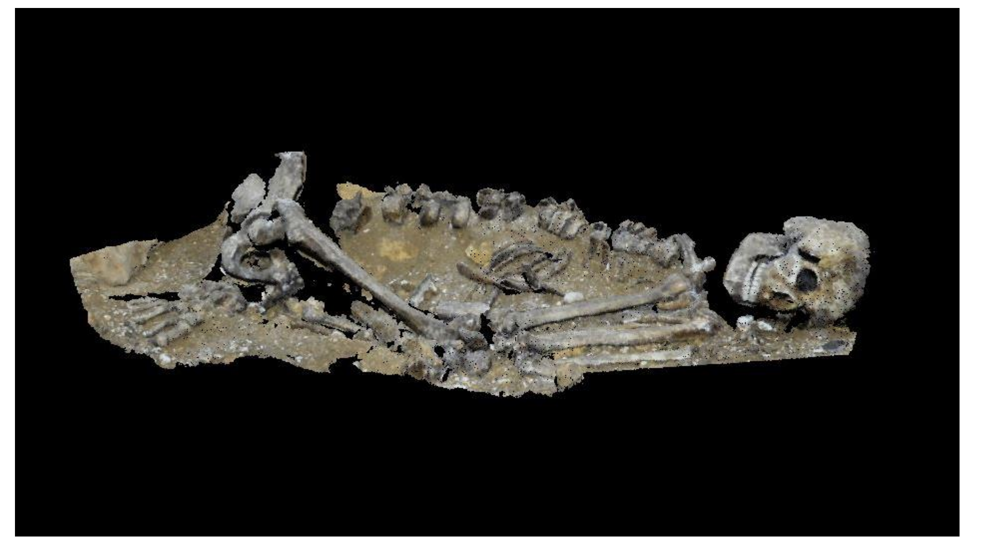
Nuage de points coloré du squelette de l'abri du Cap-Blanc, photogrammétrie.

A ce jour, une liste de descripteurs précis a été établie afin de qualifier et documenter les données. Ces métadonnées - dont certaines ne peuvent malheureusement être retrouvées à posteriori - nous donnent une première lecture de chaque fichier, et permettent maintenant non seulement de discriminer les résultats des recherches dans la base de données, mais surtout d'en améliorer la compréhension afin de cadrer les usages qui peuvent en être faits.