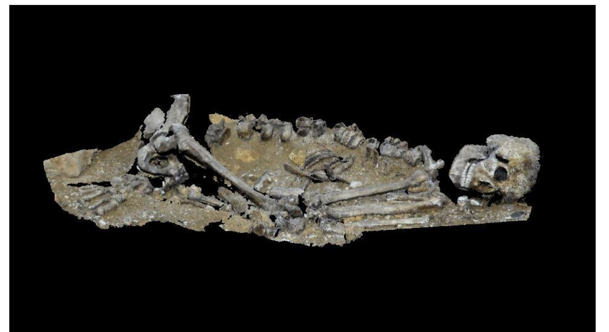
Nuage de points coloré du squelette de l'abri du Cap-Blanc, photogrammétrie.

A ce jour, une liste de descripteurs précis a été établie afin de qualifier et documenter les données. Ces métadonnées - dont certaines ne peuvent malheureusement être retrouvées à posteriori - nous donnent une première lecture de chaque fichier, et permettent maintenant non seulement de discriminer les résultats des recherches dans la base de données, mais surtout d'en améliorer la compréhension afin de cadrer les usages qui peuvent en être faits.