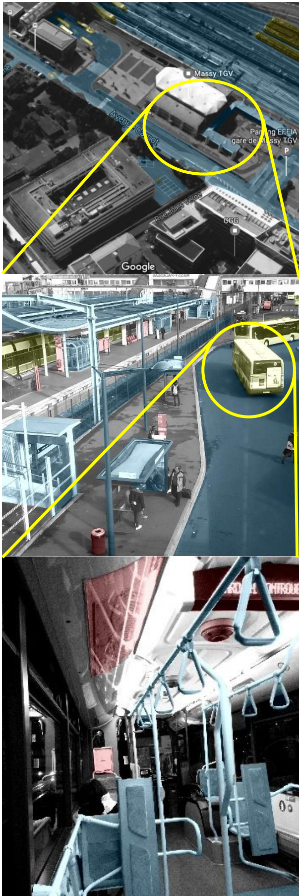
Figure 2. Composantes de mobilité à différentes échelles

Le Figure 2 montre la décomposition des STMU en composantes d'infrastructures et composantes mobiles. L'objectif sous-jacent est de mettre en évidence la nature des différentes entités au plan technique, afin que la représentation de l'expérience voyageur soit représentative des diverses échelles. Ainsi, indépendamment de l'échelle choisie, l'objet de conception sera connecté à l'ensemble du système de mobilité, permettant au concepteur de définir des fonctions en lien avec celles des autres composantes du STUM.