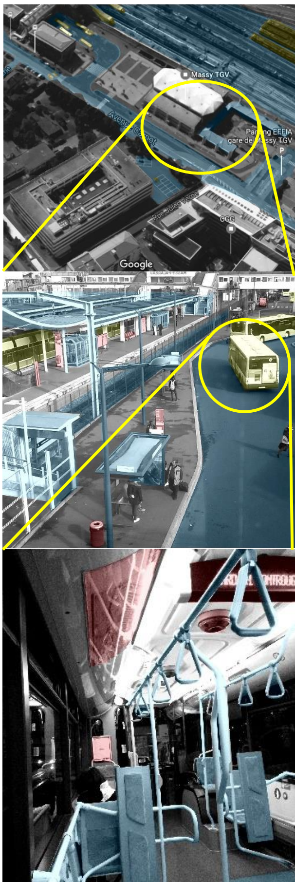
Figure 2. Composantes de mobilité à différentes échelles

Le Figure 2 montre la décomposition des STMU en composantes d'infrastructures et composantes mobiles. L'objectif sous-jacent est de mettre en évidence la nature des différentes entités au plan technique, afin que la représentation de l'expérience voyageur soit représentative des diverses échelles. Ainsi, indépendamment de l'échelle choisie, l'objet de conception sera connecté à l'ensemble du système de mobilité, permettant au concepteur de définir des fonctions en lien avec celles des autres composantes du STUM.