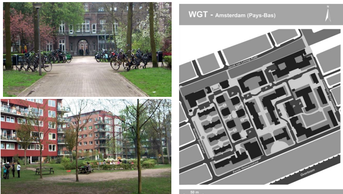
Figure 2 : Vue sur l'entrée du quartier Wilhelmina Gasthuis Terrein – Amsterdam – Pays-Bas, Auteure (A) ; Le parc à l'Est du quartier Wilhelmina Gasthuis Terrein – Amsterdam – Pays-Bas, Auteure (B) ; Plan de Wilhelmina Gasthuis Terrein – Amsterdam – Pays-Bas, Auteure (C)

Le Wilhelmina Gasthuis Terrein (WGT) à Amsterdam (Pays-Bas) est un quartier habité depuis 25 ans. Il résulte d'une opération de renouvellement urbain d'un ancien site hospitalier qui a vu le jour dans les années 1980 suite à des contestations locales quant à la démolition de l'hôpital qui a conduit à l'occupation illégale du site (Figure 2).