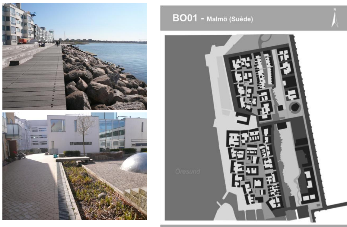
Figure 4 : La promenade à Bo01 – Malmö – Suède, Auteure (A) ; Un des nombreux « squares » à l'intérieur du quartier à Bo01 – Malmö – Suède, Auteure (B) ; Plan de Bo01– Malmö – Suède, Auteure (C)

Sea-walk at Bo01 – Malmö – Sweden, Author (A) ; On of the « squares » of Bo01 – Malmö – Sweden, Author (B) ; Map of Bo01 – Malmö – Sweden, Author (C)