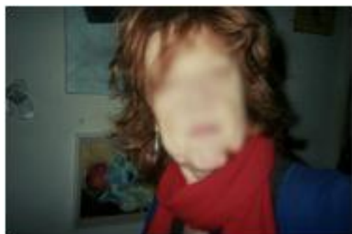
Figure 6 : “ (Photo) In my studio – wall-painting + self portrait. ” (W-B5) Extrait de baluchon multisensoriel - Extract of multisensory pouch

Dans ce registre, le journal multisensoriel a parfois une fonction de journal intime, à travers lequel les habitants nous racontent leur journée, ce qu'ils ont fait, ressenti, etc., au point d'oublier semble-t-il que l'appareil photo ou l'enregistreur finira dans les mains d'un « étranger ».