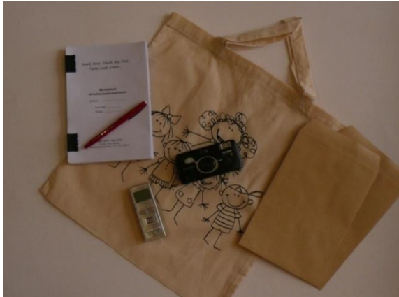
Figure 1 : Un baluchon multisensoriel – Manola, 2012

Enfin, concernant toujours les investigations auprès des habitants, une dernière approche, plus nouvelle et moins stabilisée dans le corpus des méthodes de ce champ, vise à répondre au besoin de multiplication des langages et des supports d'expression des expériences sensibles. Nous l'avons qualifiée de « baluchons multisensoriels » (Figure 1). Cette méthode originale s'inspire en partie des récits mis en place par Augoyard (2001) et des différentes méthodes avec appareils photos mises en place dans le cadre de recherches en paysage (Luginbühl, 1989 ; Michelin, 1998 ; Bigando, 2006) ou encore en urbanisme (Lelli, 2003 ; Gwiazdzinski, 2006). Elle est aussi largement inspirée des outils utilisés par les concepteurs lors de « diagnostics sensibles » ou d'« immersions dans le site » (ex. prise de photo, récolte d'objets, prise de notes), croisée à une rigueur et approche plus proches des habitudes scientifiques.