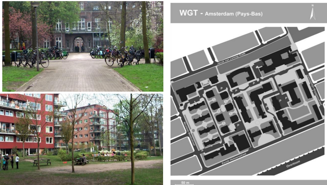
Figure 2 : Vue sur l'entrée du quartier Wilhelmina Gasthuis Terrein – Amsterdam – Pays-Bas, Auteure (A) ; Le parc à l'Est du quartier Wilhelmina Gasthuis Terrein – Amsterdam – Pays-Bas, Auteure (B) ; Plan de Wilhelmina Gasthuis Terrein – Amsterdam – Pays-Bas, Auteure (C)

Le Wilhelmina Gasthuis Terrein (WGT) à Amsterdam (Pays-Bas) est un quartier habité depuis 25 ans. Il résulte d'une opération de renouvellement urbain d'un ancien site hospitalier qui a vu le jour dans les années 1980 suite à des contestations locales quant à la démolition de l'hôpital qui a conduit à l'occupation illégale du site (Figure 2).