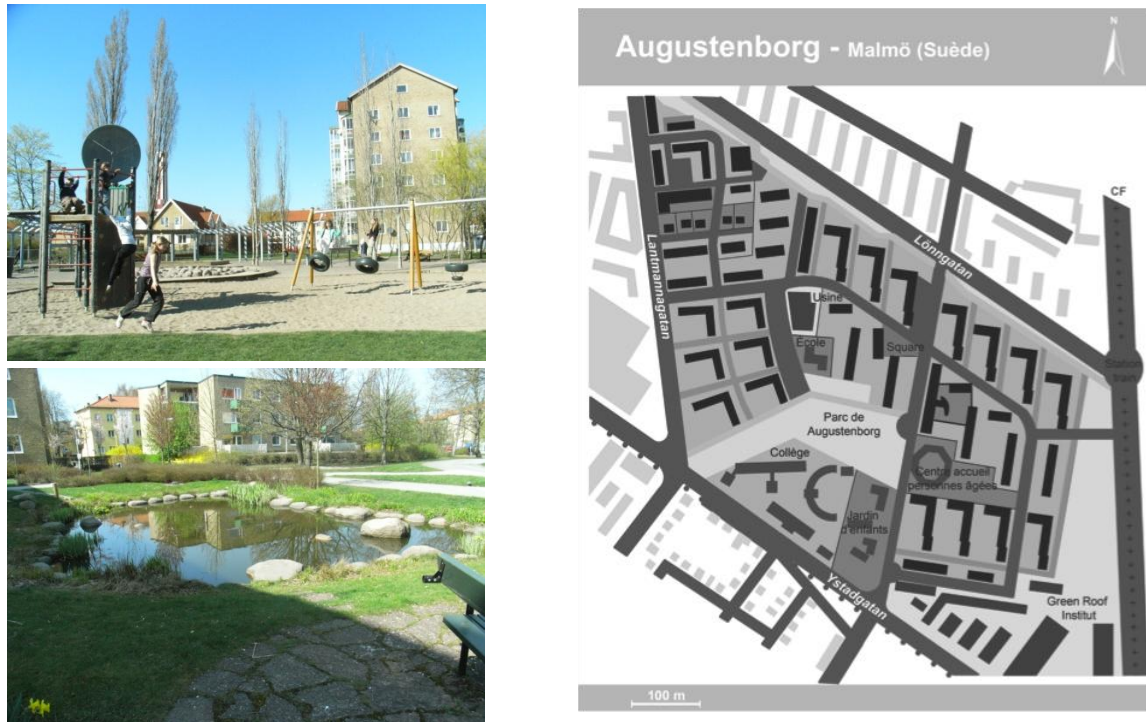
Figure 3 : Espace de jeux sonores pour enfants à Augustenborg – Malmö – Suède, Auteure (A) ; Un des espaces en bas d'immeuble à Augustenborg – Malmö – Suède, Auteure (B) ; Plan d'Augustenborg – Malmö – Suède, Auteure (C)

Augustenborg, à Malmö (Suède), est une opération de « réhabilitation écologique » d'un quartier d'habitat social de 3000 habitants, très stigmatisé. La requalification de l'espace a visé la requalification esthétique et écologique du quartier, mais aussi le respect des modes de vie spécifiques des populations et leur implication dans un processus qui est en mouvement perpétuel (Figure 3).