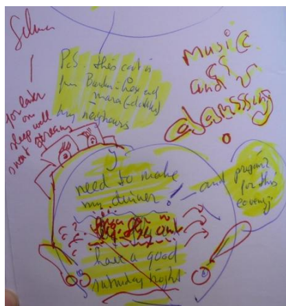
Figure 8 : Messages personnels issus du baluchon W-B5 Personal messages from the pouch W-B5

Les baluchons laissent place à des discours poétiques et (multi)sensoriels