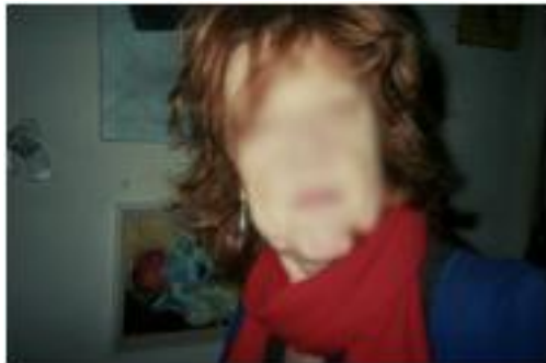
Figure 6 : “ (Photo) In my studio – wall-painting + self portrait. ” (W-B5) Extrait de baluchon multisensoriel - Extract of multisensory pouch

Dans ce registre, le journal multisensoriel a parfois une fonction de journal intime, à travers lequel les habitants nous racontent leur journée, ce qu'ils ont fait, ressenti, etc., au point d'oublier semble-t-il que l'appareil photo ou l'enregistreur finira dans les mains d'un « étranger ».