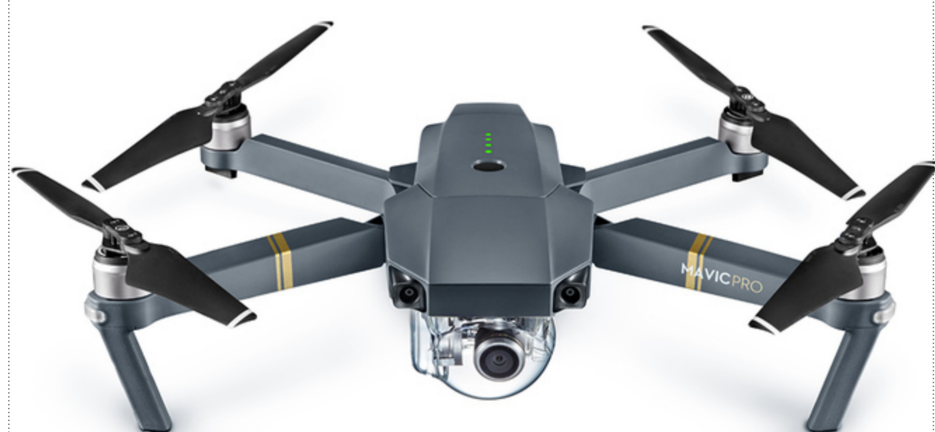
DJI MAVIC Pro