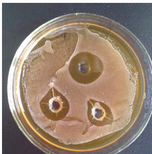
Рис. 8 Влияние октенисепта на S. aureus