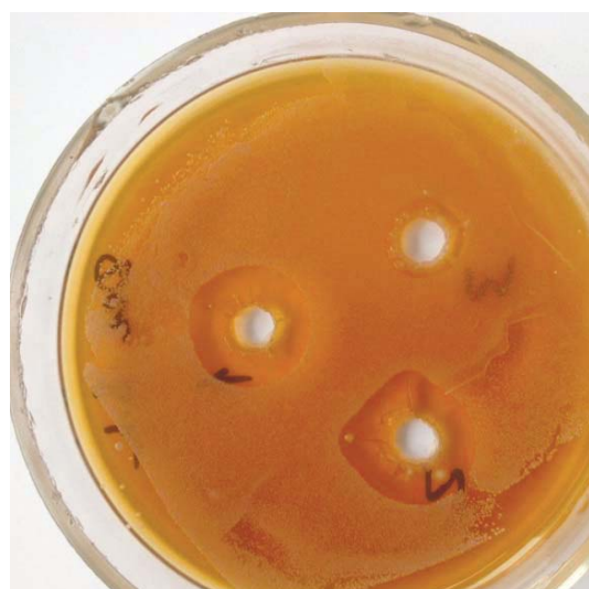
Рис. 4. Влияние диоксида на S. haemolyticus