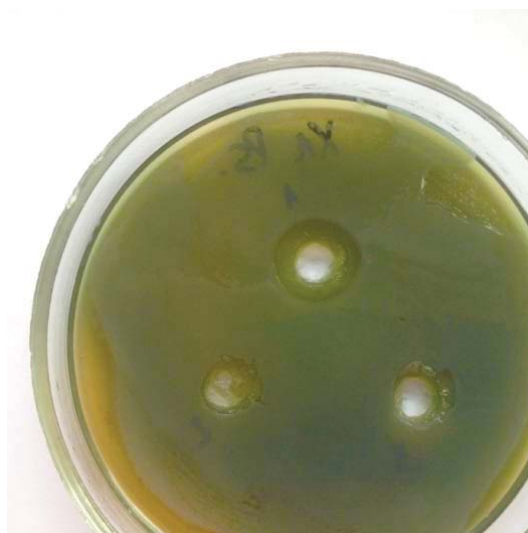
Рис. 2. Влияние хлоргексидина на P. aeruginosa