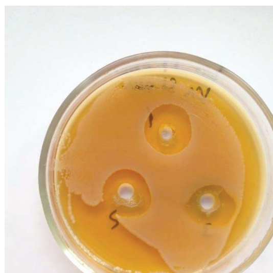
Рис. 3. Влияние хлоргексидина на S. haemolyticus