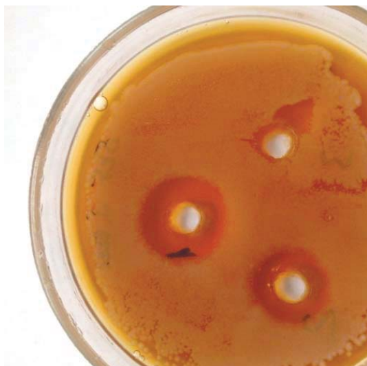
Рис. 1. Влияние бетадина на S. aureus

Результаты исследований представлены в таблицах 1, 2, 3, 4 и рисунках 1, 2, 3, 4, 5, 6, 7, 8, 9.