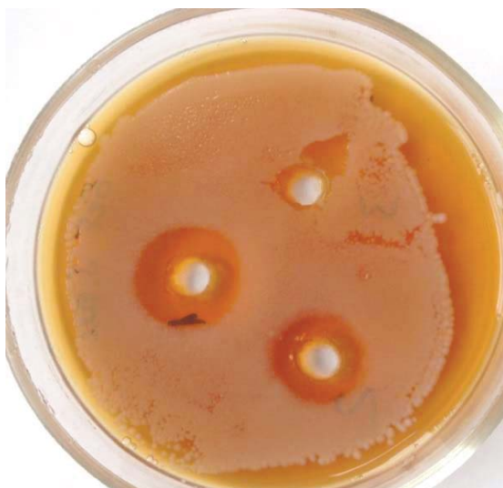
Рис. 5. Влияние бетадина на S. aureus