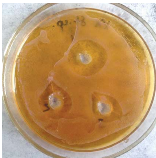
Рис. 9. Влияние хлоргексидина на S. epidermidis