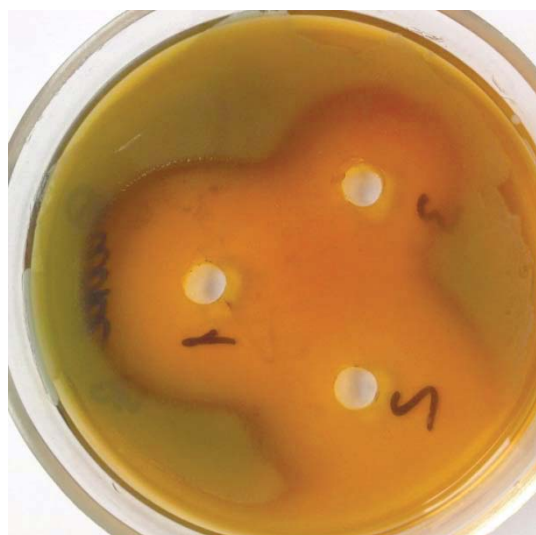
Рис. 7. Влияние диоксицина на P. aeruginosa