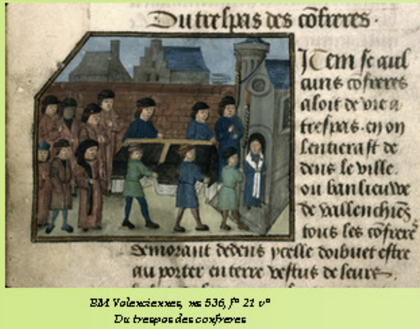
BM Valenciennes, ms 536, f° 21 v° Du trespas des cofreres