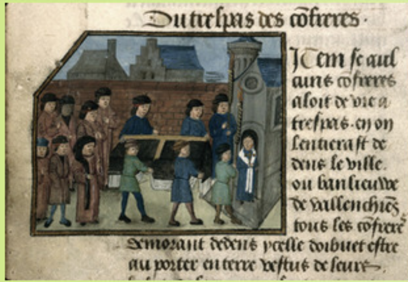
BM Valenciennes, ms 536, f° 21 v° Du trespas des cofreres