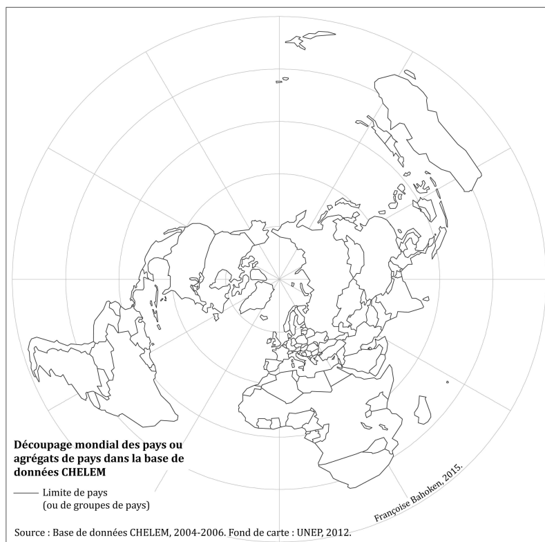
FIG. 1 – Le découpage du monde selon CHELEM.