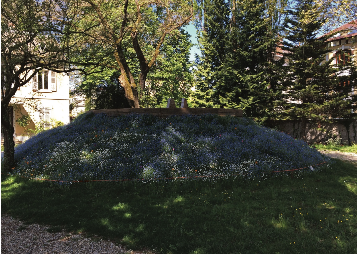
Figure 5 : Jardins Fabriques, Les Haras d'Annecy, ESAAA, 2013-2015.