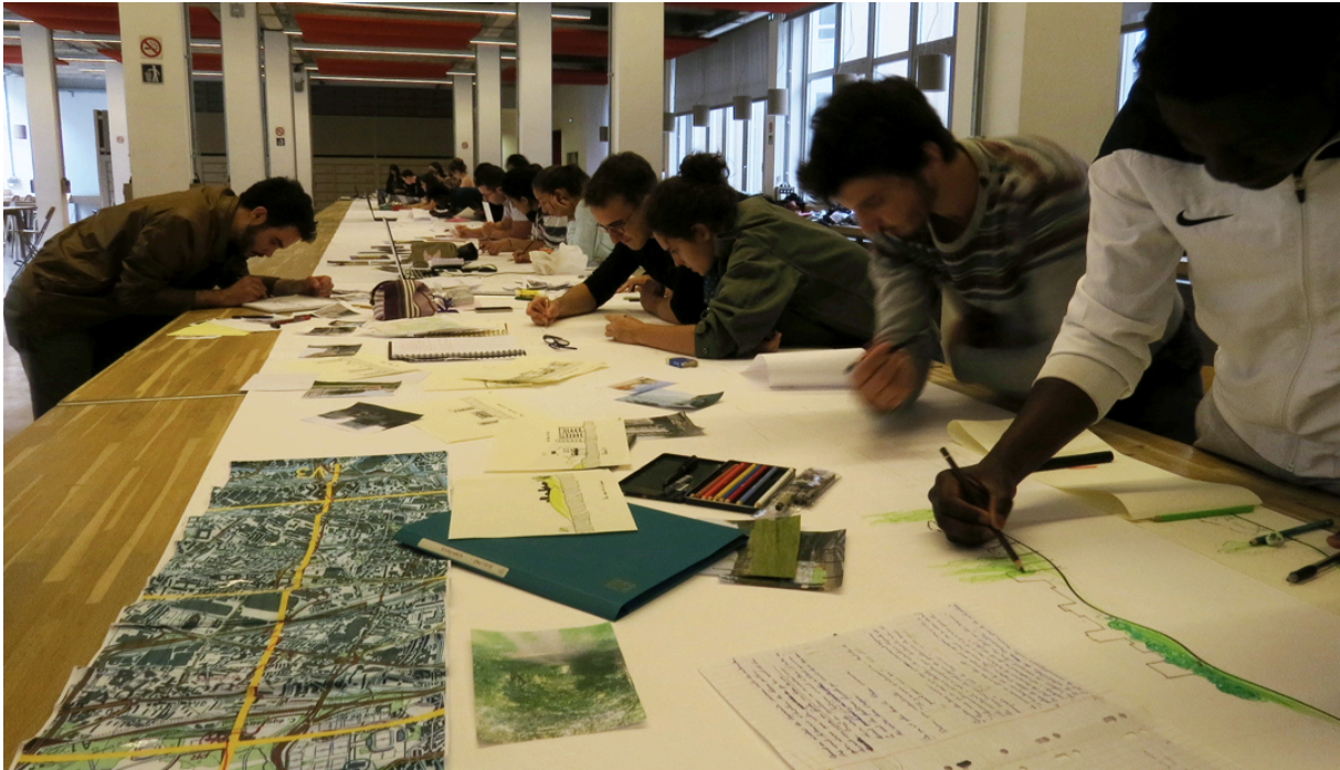
Figure 2 : GWL – Grand Workshop de Licence - Table longue - Plaine Saint-Denis – ENSA Paris La Villette - 2014