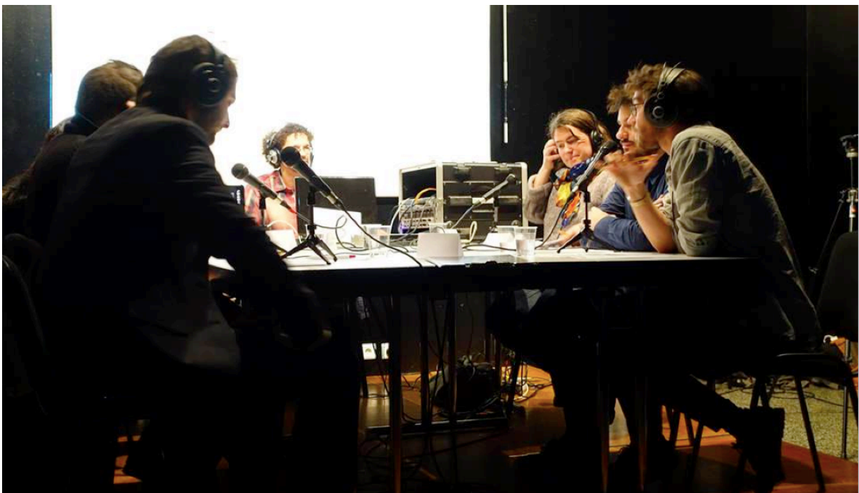
Figure 3 : Plateau radio public – Villeneuve d'Échirolles – Février 2015 – Master Design Urbain – IUG – ENSAG