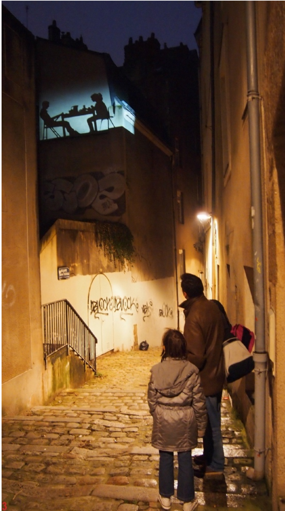
Figure 4 : « Mais qu'est-ce donc qu'un espace public ? », Expérience in situ - Licence 3 – ENSA Nantes / ESAAA – janvier 2013