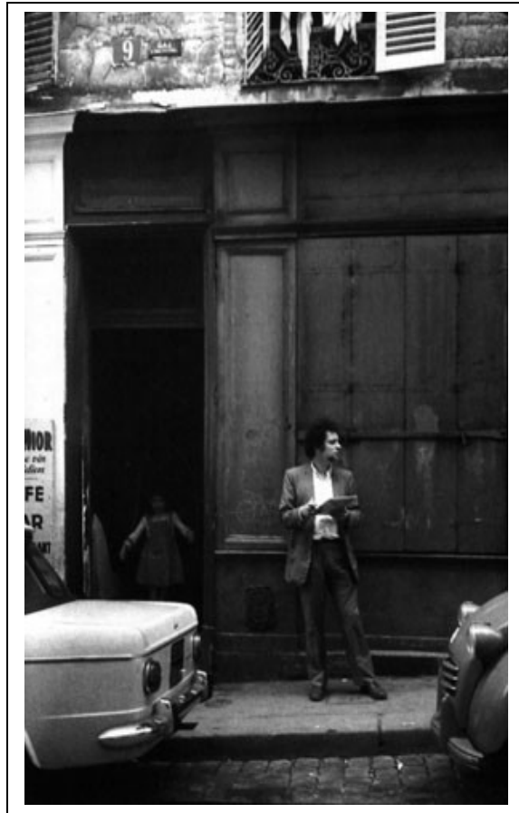
Rue Vilin, juin 1970