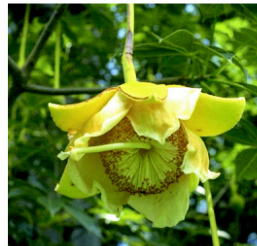
Figure 3. Fleur, feuille et fruits d' Adansonia digitata .

Mozambique, les populations d' A. digitata sont côtières ou dispersées dans les zones de basse altitude et dans la savane. En Angola et en Namibie elle est plutôt trouvée dans les régions boisées, tandis qu'au Zimbabwe et au nord de l'Afrique du Sud