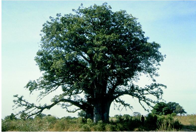
Figure 2. Vue d'ensemble d' Adansonia digitata .

A. digitata est indigène des steppes sahéliennes et des savanes soudano-sahéliennes [2, 4, 10]. Cette espèce de baobab est présente dans la plupart des régions semi-arides et subhumides du sud du Sahara ( figure 1 ). Elle est souvent localisée à proximité des habitations. La zone de distribution du baobab est très vaste. À l'Ouest, elle s'étend du Cap-Vert aux plaines côtières du Ghana, Bénin et Togo. Au Nord, elle est limitée par le Sahara. En Érythrée et en Somalie, l'arbre est typique des plaines, tandis qu'au Soudan il se développe dans les montagnes du Nouba et jusqu'à 1500 m d'altitude en Éthiopie. Au Kenya et plus au Sud vers le