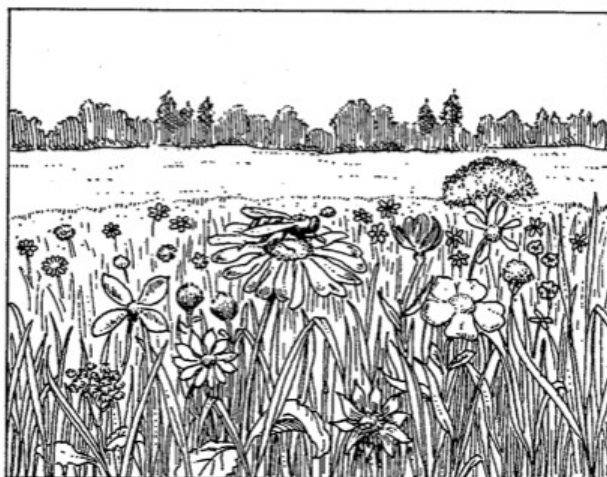
Pl. 5a. L'entourage de l'abeille

entre le « milieu » ou le « monde propre » ( Umwelt ) et « l'environnement » ou « l'entourage » ( Umgebung ). Le premier est le monde perceptif vécu de l'animal, en tant qu'il est propre à son espèce et qu'il dépend directement des appareils sensoriels dont l'espèce est dotée. Le second est « l'entourage que nous voyons s'étendre autour de lui » (Uexküll, 1934, p. 29), c'est-à-dire « notre propre milieu humain » en tant qu'il constitue à son tour un monde perceptif (qui nous est) propre ( fig. 1 ).