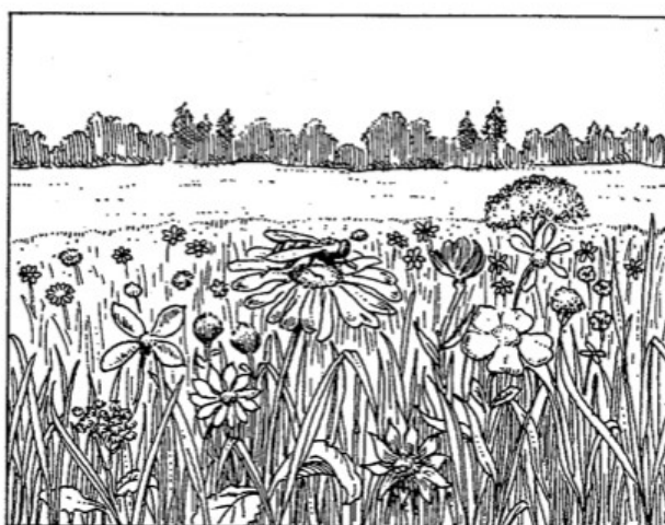
Pl. 5a. L'entourage de l'abeille

entre le « milieu » ou le « monde propre » ( Umwelt ) et « l'environnement » ou « l'entourage » ( Umgebung ). Le premier est le monde perceptif vécu de l'animal, en tant qu'il est propre à son espèce et qu'il dépend directement des appareils sensoriels dont l'espèce est dotée. Le second est « l'entourage que nous voyons s'étendre autour de lui » (Uexküll, 1934, p. 29), c'est-à-dire « notre propre milieu humain » en tant qu'il constitue à son tour un monde perceptif (qui nous est) propre ( fig. 1 ).