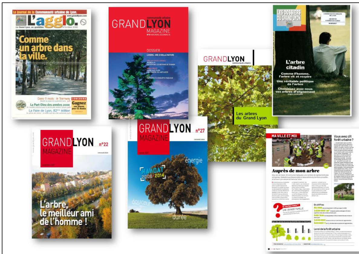
Figure 4. Les otages célébrés. Parmi ces pages de couvertures, notons celle du Grand Lyon magazine n°27 (janvier 2009) : l'image du chêne millénaire, vigoureux, robuste et majestueux est associée à la seconde mandature Gérard Collomb en tant que maire de Lyon et sénateur-maire de la Communauté Urbaine de Lyon (Grand Lyon).

La figure 4 laisse entrevoir les différentes manières dont l'arbre est convoqué dans la presse.