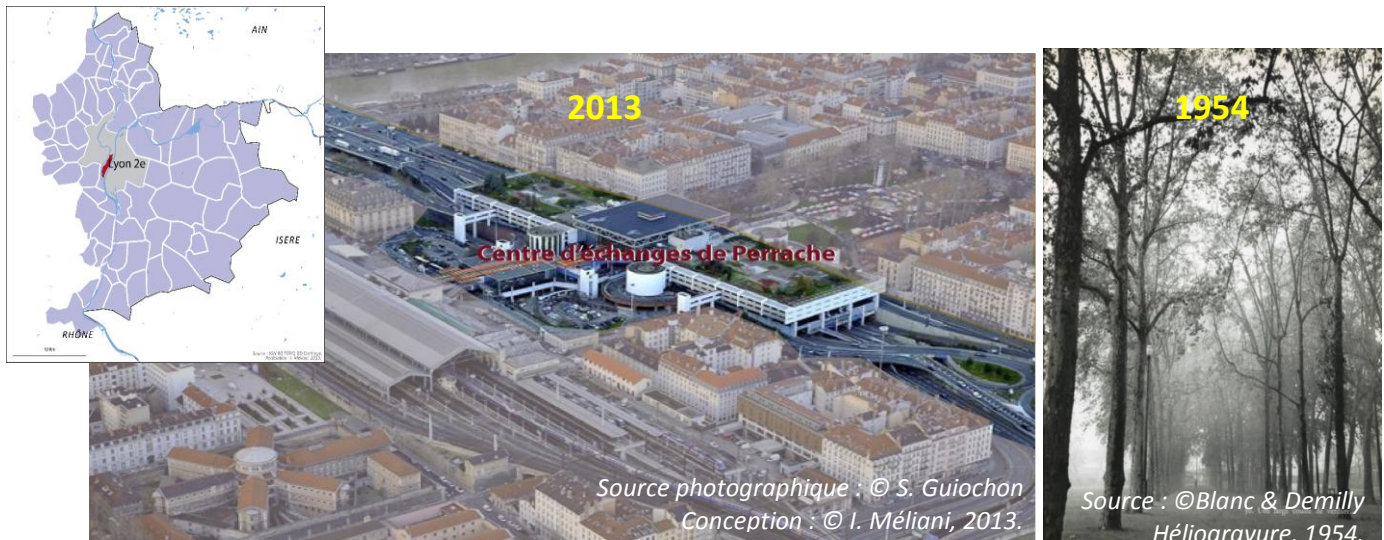
Figure 3. Les otages sacrifiés. Les arbres du Cours de Verdun (1954) disparaissent pour laisser place au centre d'échange autoroutier de Perrache (2ème arrondissement de Lyon).

Il y a donc à partir de ce moment une sorte de réveil, une prise de conscience faisant se réunir les acteurs autour de l'arbre qui devient alors un bien à préserver et à mettre en valeur.