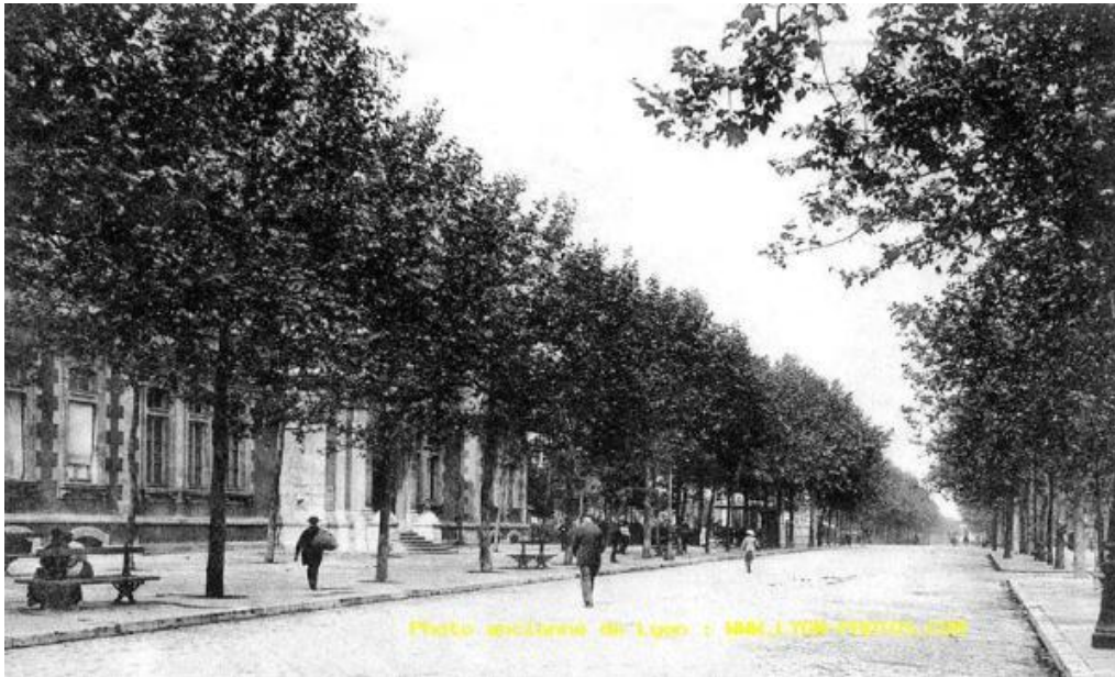
Figure 1. Les remparts des pentes de la Croix-Rousse font place au boulevard de la Croix-Rousse (4ème arrondissement de Lyon) et à ses 930 platanes plantés en 1856, Photo archives départementales, Lyon.

Il n'en reste pas moins que peu à peu, le géôlier s'est vu pactiser avec l'otage, atteint sans doute de ce que l'on appelle le « syndrome de Stockholm ». L'arbre retenu prisonnier et les citadins ont en effet fini par faire cause commune : les habitants, du fait de sa présence bienfaisante, s'accommodent désormais avec bonheur de la présence familière de l'arbre dans leur paysage et leur cadre de vie ; quant aux arbres, confortés par les soins qui leur sont prodigués et par un certain respect qui leur est témoigné, ils se sentent le droit de s'épanouir avec une certaine aisance dans leurs fonctions d'ornement.