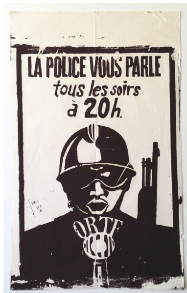
Tract de l’Atelier populaire des Beaux Arts (Paris, Mai 68)

Enfin, le tract se situe à mi-chemin entre l’affiche et la brochure. « L’affiche et le tract [...] doivent être d’une rédaction brève et frappante » (Domenach, 1950). Sorte de version « à emporter » du placard mural, il peut aussi en avoir la multimodalité. Dans leur étude sur la sémiotique visuelle des tracts d’extrême droite britannique et autrichienne, John E. Richardson et Ruth Wodak (2009 : 50) affirment que « les tracts politiques sont des genres discursifs multimodaux » dans lesquels le visuel peut être un argument, au sens rhétorique du terme. Mais il semblerait que cette multimodalité s’estompe : « Depuis le début du XX e siècle, on assiste à une normalisation et à un appauvrissement à la fois du vocabulaire, du graphisme et des formes » (Barnoud, 1996 : 27). Jusqu’à la Seconde Guerre mondiale « cette utilisation graphique était souvent alliée à une présentation typographique originale et inventive. [...] Les tracts contemporains frappent au contraire par la primauté donnée au texte, présenté sans beaucoup de fantaisie et souvent peu concis » ( ibid. ). Le tract partage par ailleurs avec la brochure son caractère textuel, mais aussi un certain nombre de traits : c’est « un support privilégié de diffusion des idées et d’expression qui peut émerger hors de l’institution. Des textes courts, qui peuvent être écrits sur le vif et circuler rapidement, un média peu coûteux et peu surveillé, à l’anonymisation et à la diffusion faciles » (Abbou, 2017 : 67).