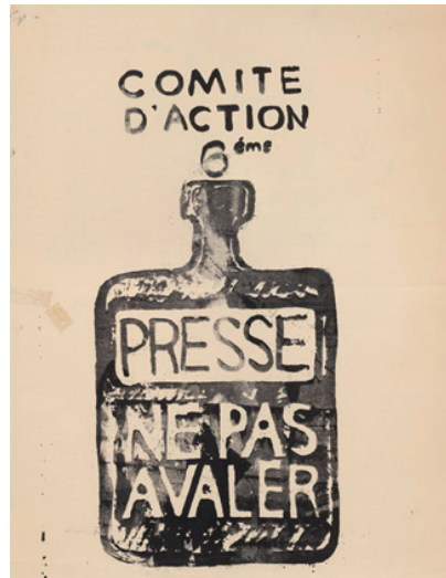
Tract de l'Atelier populaire des Beaux Arts (Paris, Mai 68), ou quand un média figure un autre média (la presse) comme poison

volontiers à l'utilisation de formules (Krieg-Planque, 2009), mais aussi de slogans et de figures qui visent à fonder la structure du réel (Perelman, Olbrechts-Tyteca, 1958).