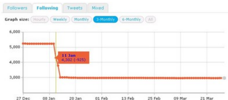
Figure 2 : Exemple de désabonnement massif de comptes – Outil : Twittercounter

L'instrumentalisation des usages de Twitter a conduit également à des pratiques plus extrêmes, peu éthiques, dont l'enjeu en termes de réputation est de se donner une image « d'expert », en se basant uniquement sur la puissance des chiffres. Une massification des actions d'abonnements et de désabonnements dans une courte période, connue dans le milieu professionnel par les termes de « follow back systématique » et de « mass unfollow » consiste à chercher à augmenter rapidement le nombre d'abonnés, puis à réduire celui d'abonnements, afin d'avoir un ratio abonnés sur abonnements le plus élevé possible. Ces actions de massification des abonnements, à visée purement stratégique, traduisent une connaissance des mécanismes et des tactiques afin d'améliorer une forme de réputation, prise en compte beaucoup plus par des cercles d'utilisateurs élargis (médias, usagers entrants, usagers d'autres cercles) que par les « pairs ».