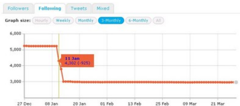
Figure 2 : Exemple de désabonnement massif de comptes – Outil : Twittercounter

L'instrumentalisation des usages de Twitter a conduit également à des pratiques plus extrêmes, peu éthiques, dont l'enjeu en termes de réputation est de se donner une image « d'expert », en se basant uniquement sur la puissance des chiffres. Une massification des actions d'abonnements et de désabonnements dans une courte période, connue dans le milieu professionnel par les termes de « follow back systématique » et de « mass unfollow » consiste à chercher à augmenter rapidement le nombre d'abonnés, puis à réduire celui d'abonnements, afin d'avoir un ratio abonnés sur abonnements le plus élevé possible. Ces actions de massification des abonnements, à visée purement stratégique, traduisent une connaissance des mécanismes et des tactiques afin d'améliorer une forme de réputation, prise en compte beaucoup plus par des cercles d'utilisateurs élargis (médias, usagers entrants, usagers d'autres cercles) que par les « pairs ».