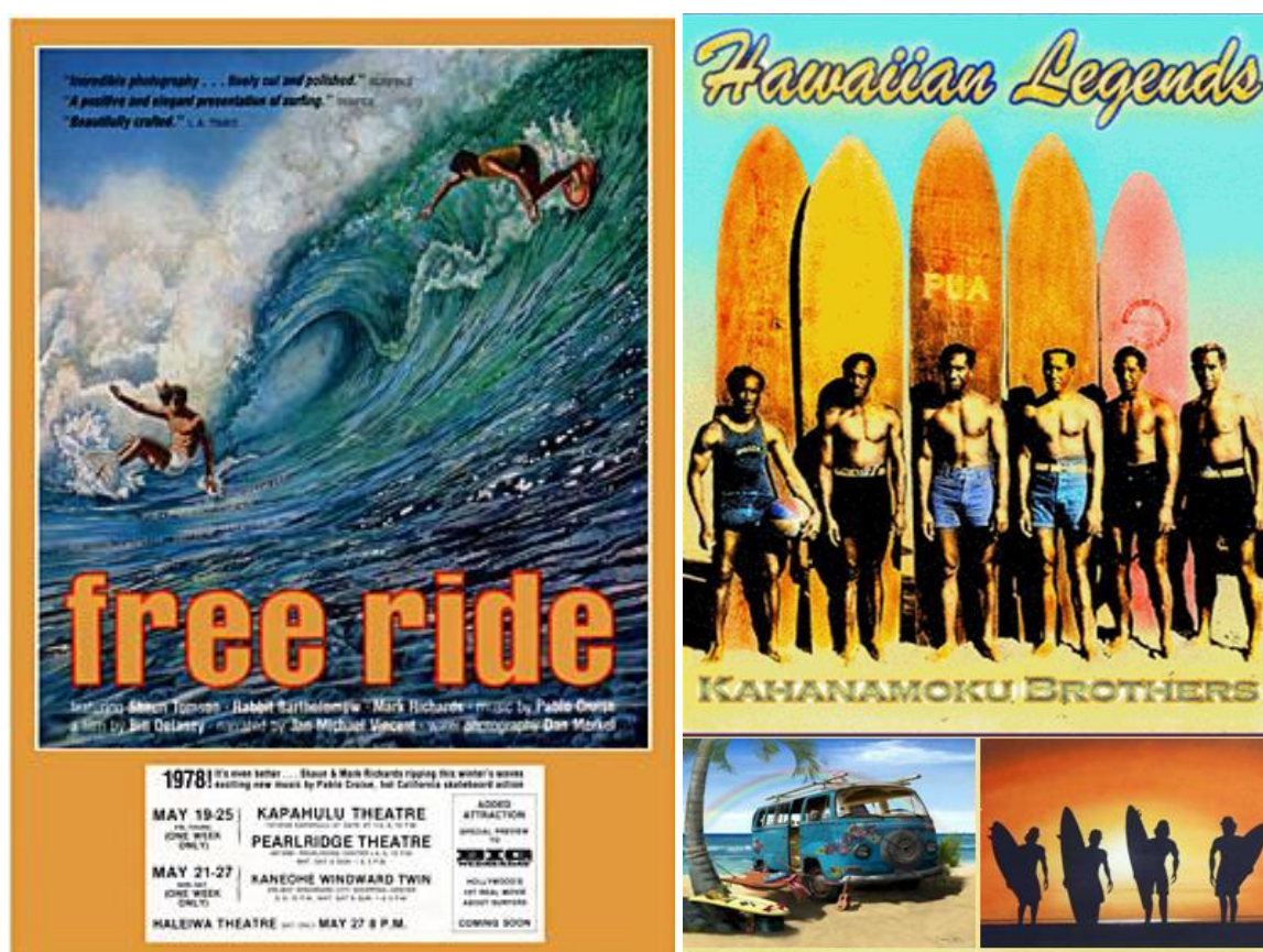
Figure 1: Affiches « alternatives » de surf dans les années 1970 - 1980