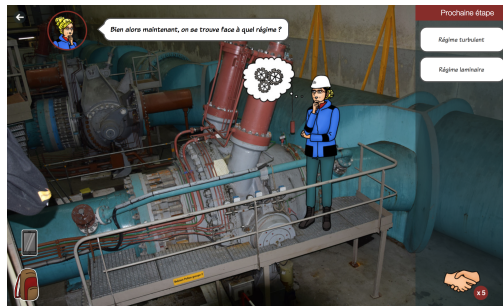
FIGURE 3. Capture d'écran du learning game “Missions à Emosson”

L'enseignant-auteur a conçu ce learning game comme une activité du MOOC “Introduction à la mécanique des fluides”. Il souhaitait apporter aux apprenants une activité basée sur une situation réelle mobilisant et faisant travailler les compétences vues lors du MOOC . Le learning game se situe dans le complexe d'Emosson en Suisse non loin du massif du Mont Blanc. L'apprenant-joueur devra vivre le quotidien d'un ingénieur mécanicien des fluides en poste à Emosson S.A. et résoudre les problèmes et situations qui lui seront proposés. “Missions à