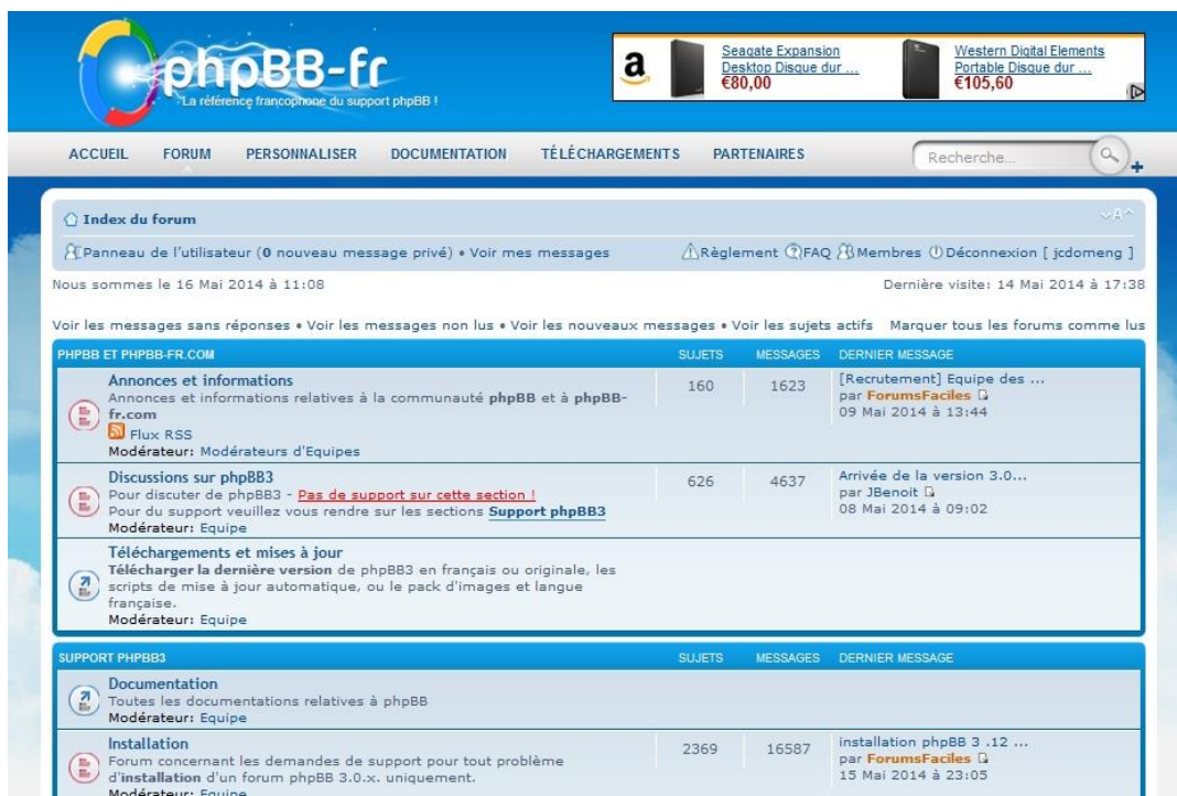
Figure 4 : architecture technique du modèle de forum privé phpBB 8

Que ce soit sous la forme de la timeline , empilant les messages de manière antéchronologique ou des catégories, classant les messages par sujets de discussion, le classement des contenus est au cœur des interactions cadrées par les dispositifs du Web social. Les forums privés sont l'exemple historique et emblématique de ces dispositifs, dans lesquels les interactions reposent sur la qualité du contenu partagé et le respect des règles d'interactions. Ils permettent de créer et de maintenir des liens au sein de collectifs, tissés autour de contenus partagés et d'échanges relatifs à un thème rassembleur.