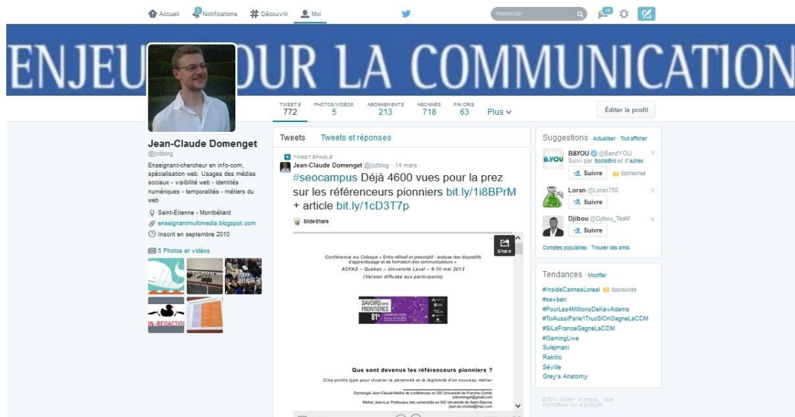
Figure 2 : architecture technique de Twitter

L'instabilité, l'inachèvement des dispositifs du Web social constituent un état durable (Latsko-Toth, 2010). Cette instabilité touche notamment les plateformes de partage de vidéo (Dailymotion, Youtube), de photos (Flickr, Instagram, Pinterest), de micro-blogging telles Twitter, de ressources d'information (Netvibes) ou de savoirs (Wikipedia), centrées sur un intérêt et la publication de contenu. Si les évolutions régulières des architectures techniques illustrent « une facilité du dispositif à s'auto-ajuster au fur et à mesure des souhaits des usagers » (Di Gangi et Wasco, 2009), les évolutions récentes marquées par des controverses 4 traduisent également la stratégie d'entreprises dont les modèles économiques visent à une exploitation de la participation (Rebillard, 2011). L'exemple de Twitter et de ces multiples évolutions de l'architecture technique est ici marquant. Twitter se présente aujourd'hui comme l'archétype d'un dispositif complexe, intégrant des formes d'énonciation spécifiques à des groupes professionnels, réduisant d'autant plus l'ouverture et l'accessibilité aux collectifs qui se sont formés dans ces dispositifs 5 .