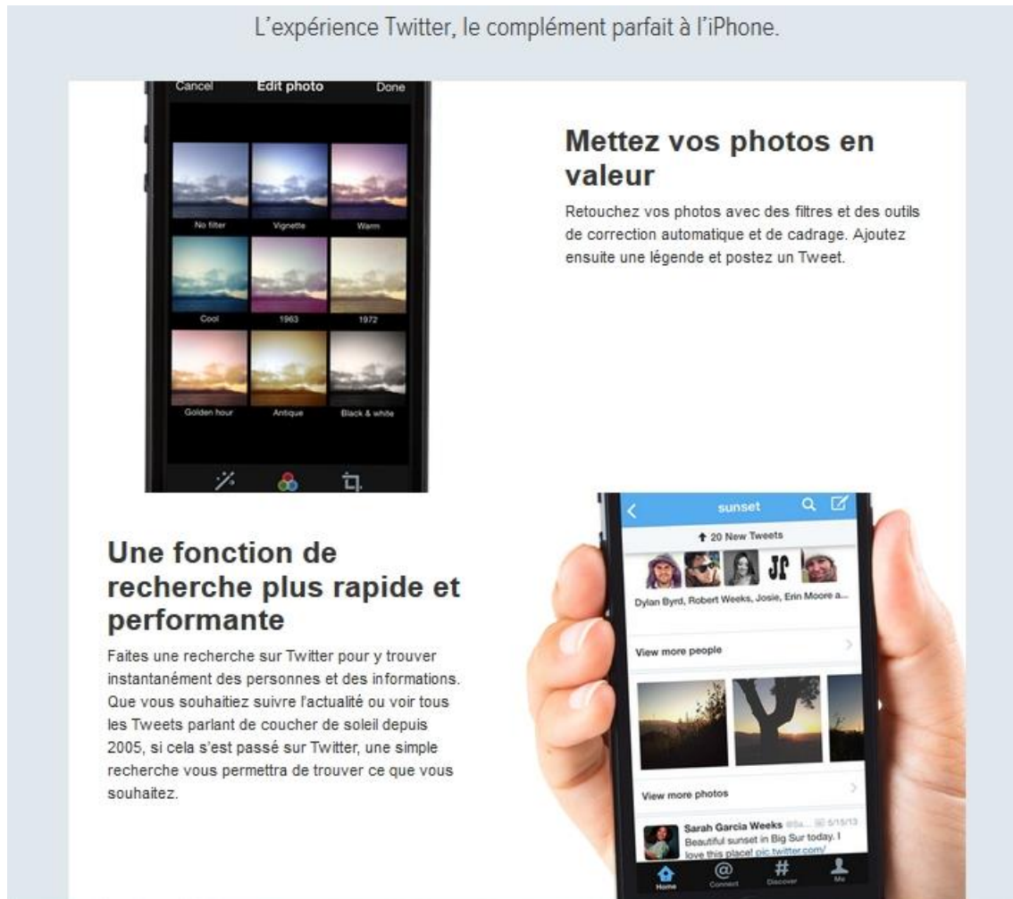
Figure 5 : Application Twitter pour Iphone

prendrons l'exemple de Twitter pour préciser les changements d'architecture technique et des formes d'interaction selon les supports 9 .