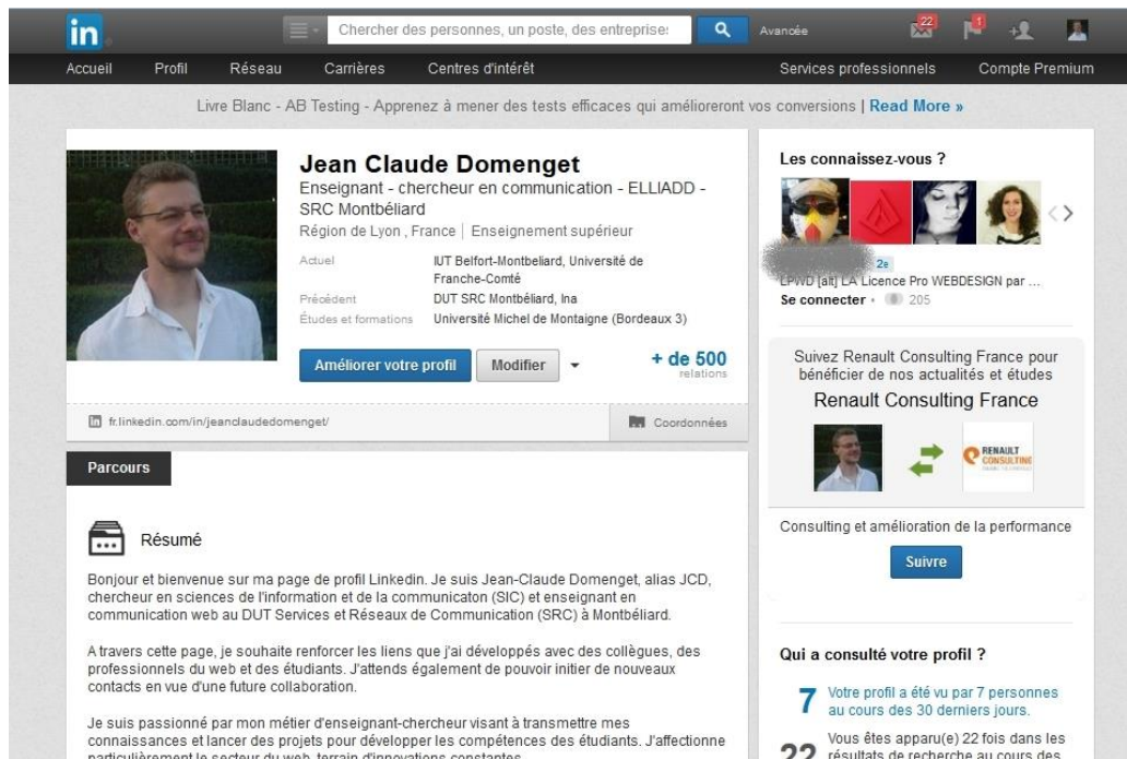
Figure 3 : architecture technique de LinkedIn

LinkedIn est un très bon exemple de ces systèmes de recommandation visant à élargir continuellement les cercles relationnels des usagers, dont les interactions sont cadrées par des algorithmes. Dans cette « famille » des sites de réseautage ou réseaux sociaux professionnels, la démarche de promotion de soi autour de centres d'intérêts s'intègre dans des formes d'interaction adaptées aux normes sociales et aux cadres de référence du monde professionnel. Sans que les usagers en aient forcément conscience, les possibilités d'interactions offertes par ce dispositif dépend d'un filtrage des comptes puis des messages issu d'algorithmes avancés (Cardon, 2013) 7 .