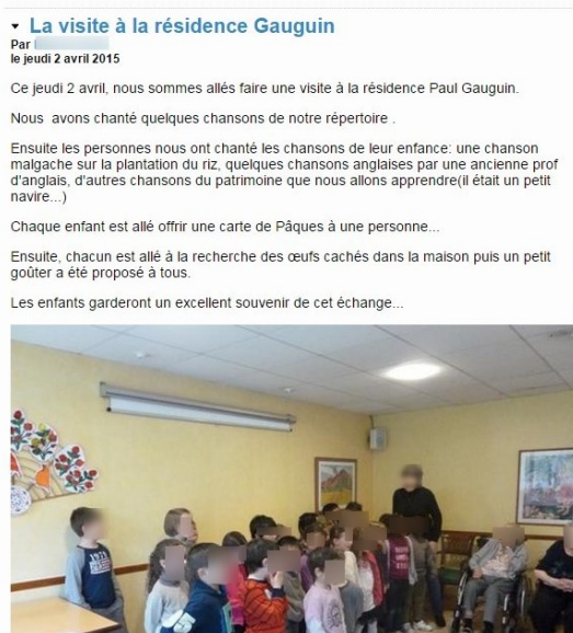
Figure 2 • Exemple de thématique communicationnelle sur le Blog

Nous avons pu accéder aux blogs et cahiers multimédias des classes par l'intermédiaire d'un compte invité, ouvert avec l'autorisation des enseignants et de la direction, dans chaque école étudiée. En effet, les ENT fonctionnent sur la base de comptes personnels ayant une authentification unique. Aucune consultation n'est possible sans cet accès. Nous avons observé les publications réalisées sur l'ENT ONE par 26 enseignants et 71 élèves de 12 écoles différentes des Académies de Caen et Versailles entre septembre 2014 et juin 2015. Ce corpus d'analyse est composé de 1102 publications (voir tableau 2). Notre étude concerne donc, à ce stade, uniquement les activités de publication. Pour évaluer l'appropriation à partir des activités de consultation, nous avons prévu d'analyser dans une étude ultérieure les statistiques de connexion à la plateforme.