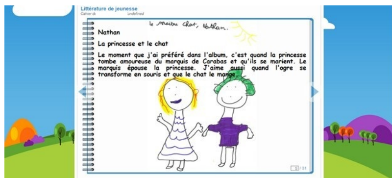
Figure 4 • Exemple de thématique pédagogique (rédigé par un élève)

sé un cahier multimédia musical pour recueillir des comptines d'autrefois fournies par des parents d'élèves et des grands parents et a ensuite organisé des rencontres musicales avec les parents et grands-parents volontaires pour chanter avec les élèves. Il s'agissait d'un projet intergénérationnel et collaboratif, où les élèves pouvaient apprendre et chanter ces comptines disparues, accompagnés par des aînés. L'ENT a été utilisé pour recueillir des notes musicales, le texte des comptines mais aussi des fichiers audio. Ces supports ont été rendus accessibles à tous les acteurs, enseignants, élèves, parents, en classe comme à la maison.